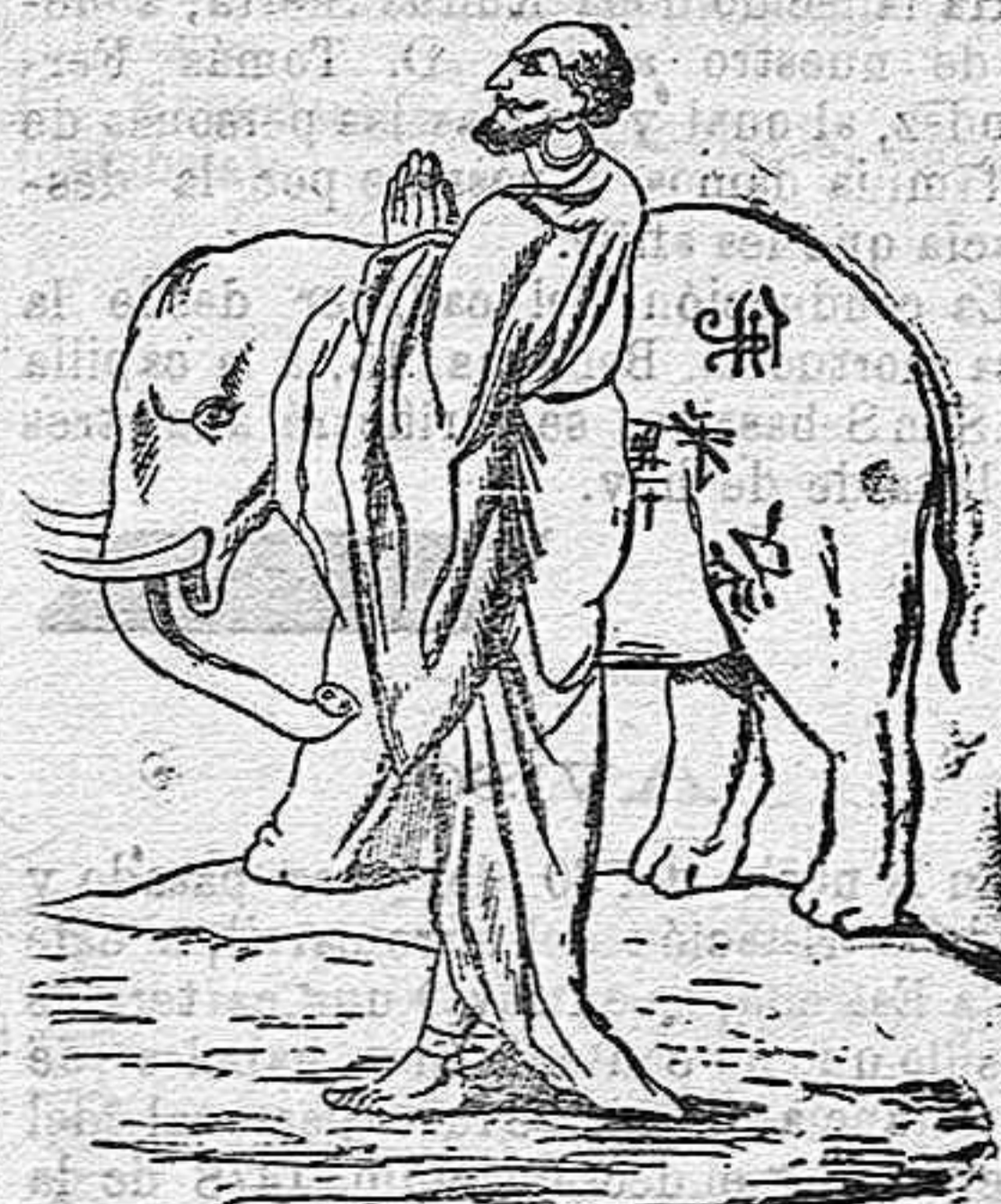
ELEFANTES BLANCOS DE SIAM

Los siameses y pegunos consideran á los elefantes blancos como los reyes de la especie, cuando, por el contrario, puede decirse que esos animales ocupan el úl-