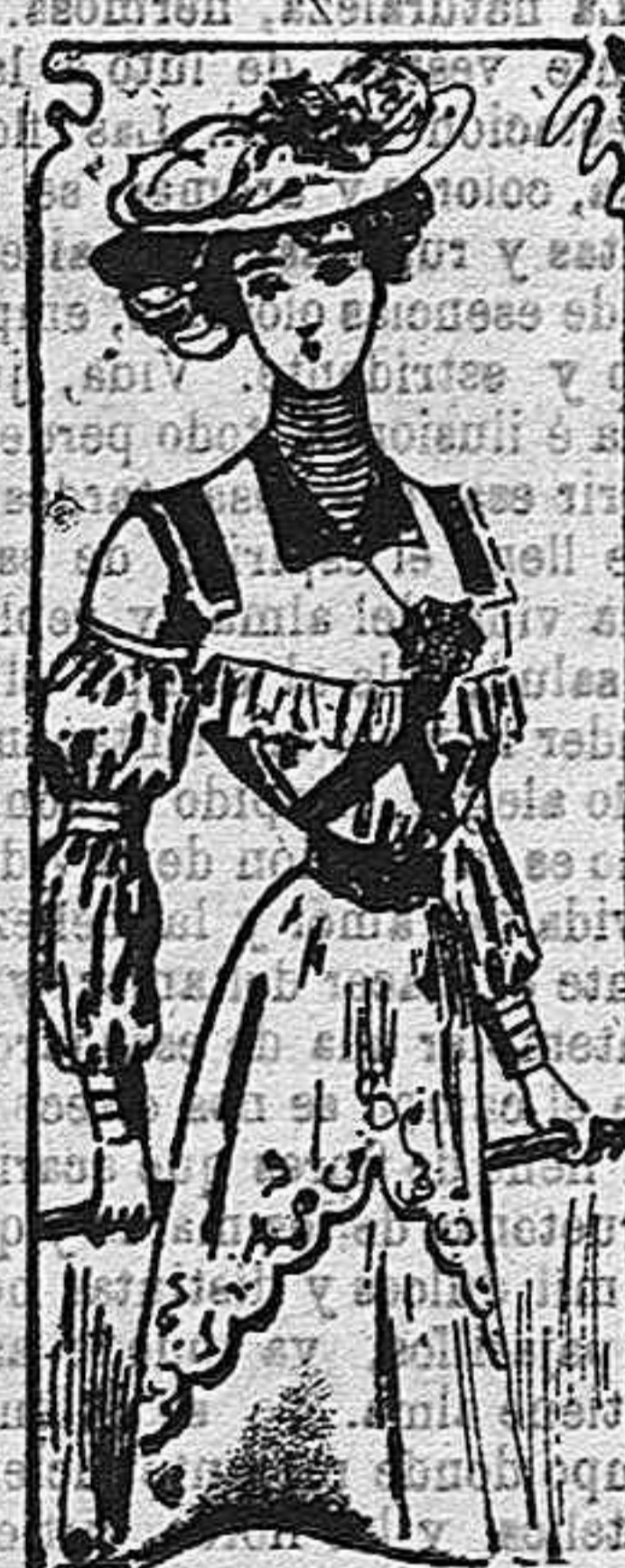
Traje de mañana.

Muy pronto un ligero ciérzo se hará sentir por las mañanas y nuestras elegantes damas habrán de precaverse contra aquél, adaptando a su cuerpo telas algo más consistentes que las usadas durante el estío.