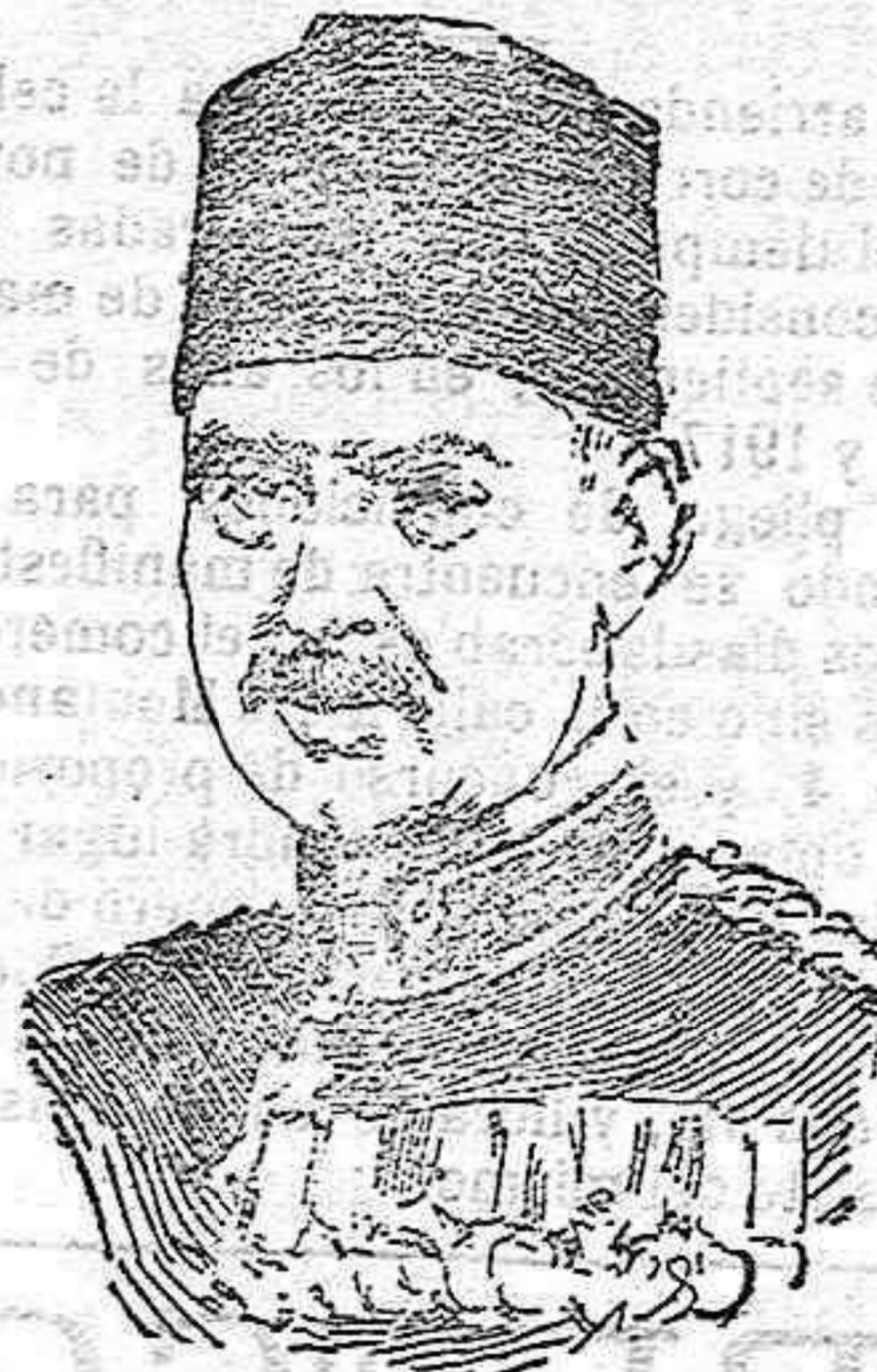
El general Limán von Sanders, jefe de la Misión instructora alemana del ejército turco á quien ha ido á sustituir el general Von der Goltz