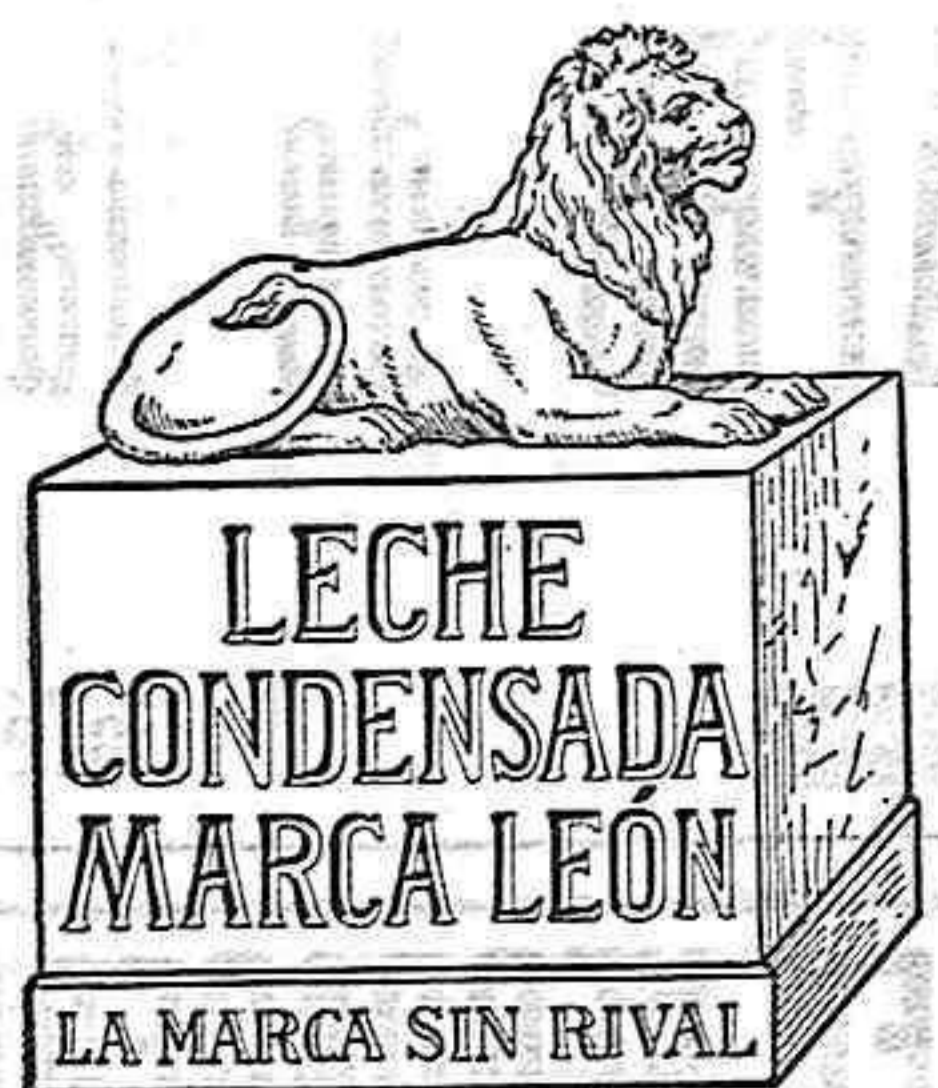
Natura-Milch-Exportgesellschaft, Bosch & Co., m. H. Waren in Mecklenburg.