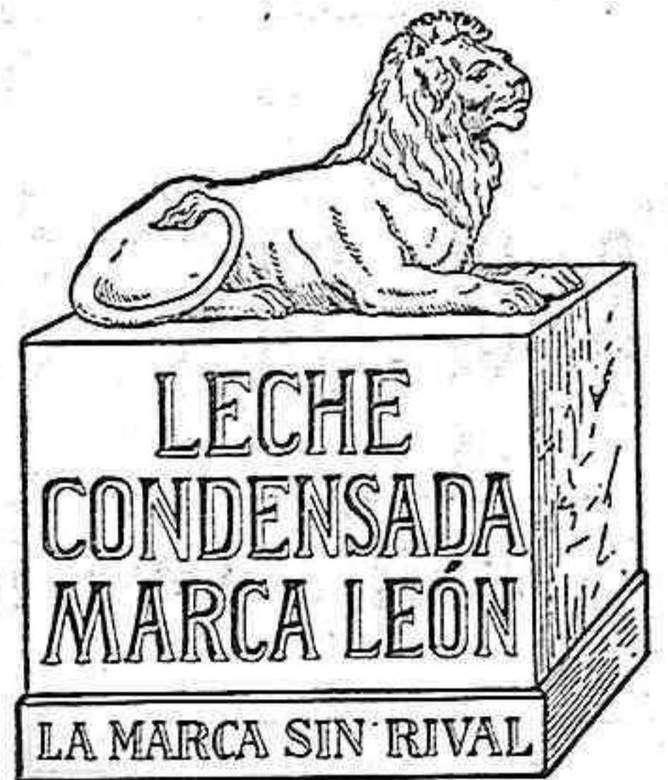
La Marca Sin Rival

Esta casa sirve el café completamente puro, sin ponerle en el tueste azúcar ni ninguna otra sustancia, que le hace perder sus condiciones higiénicas.