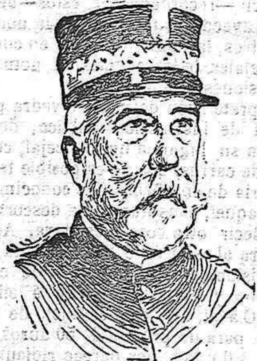
El general García Aldave