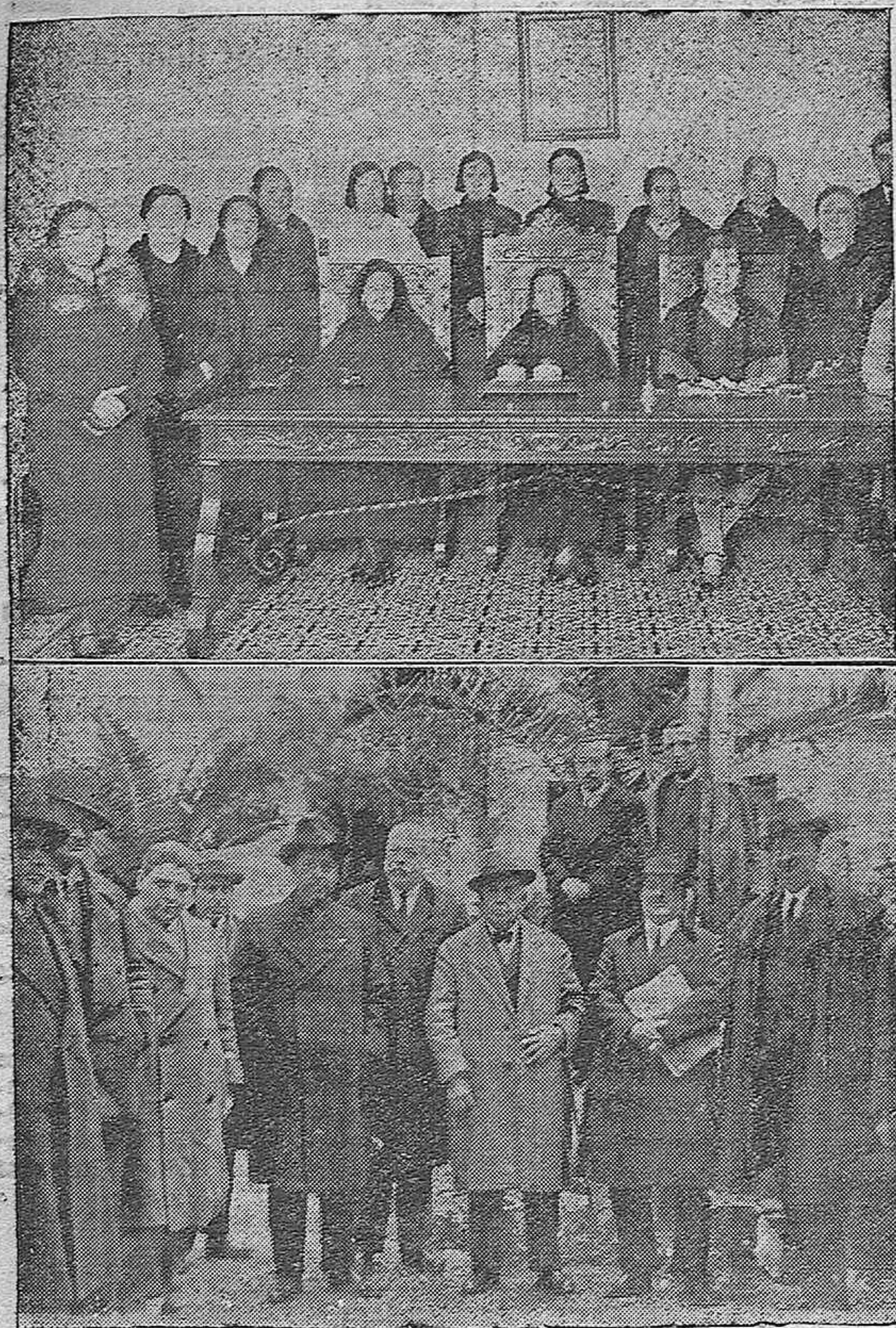
Arriba: Presidencia de la Asamblea verificada ayer por las Matronas, asistiendo colegiadas de la provincia y cuyo acto tuvo lugar en el Colegio Médico, celebrando después un banquete.—Abajo: Directivos de la Hermandad de los Dolores que se reunieron para tomar acuerdo sobre la salida de la Procesión en Semana Santa.