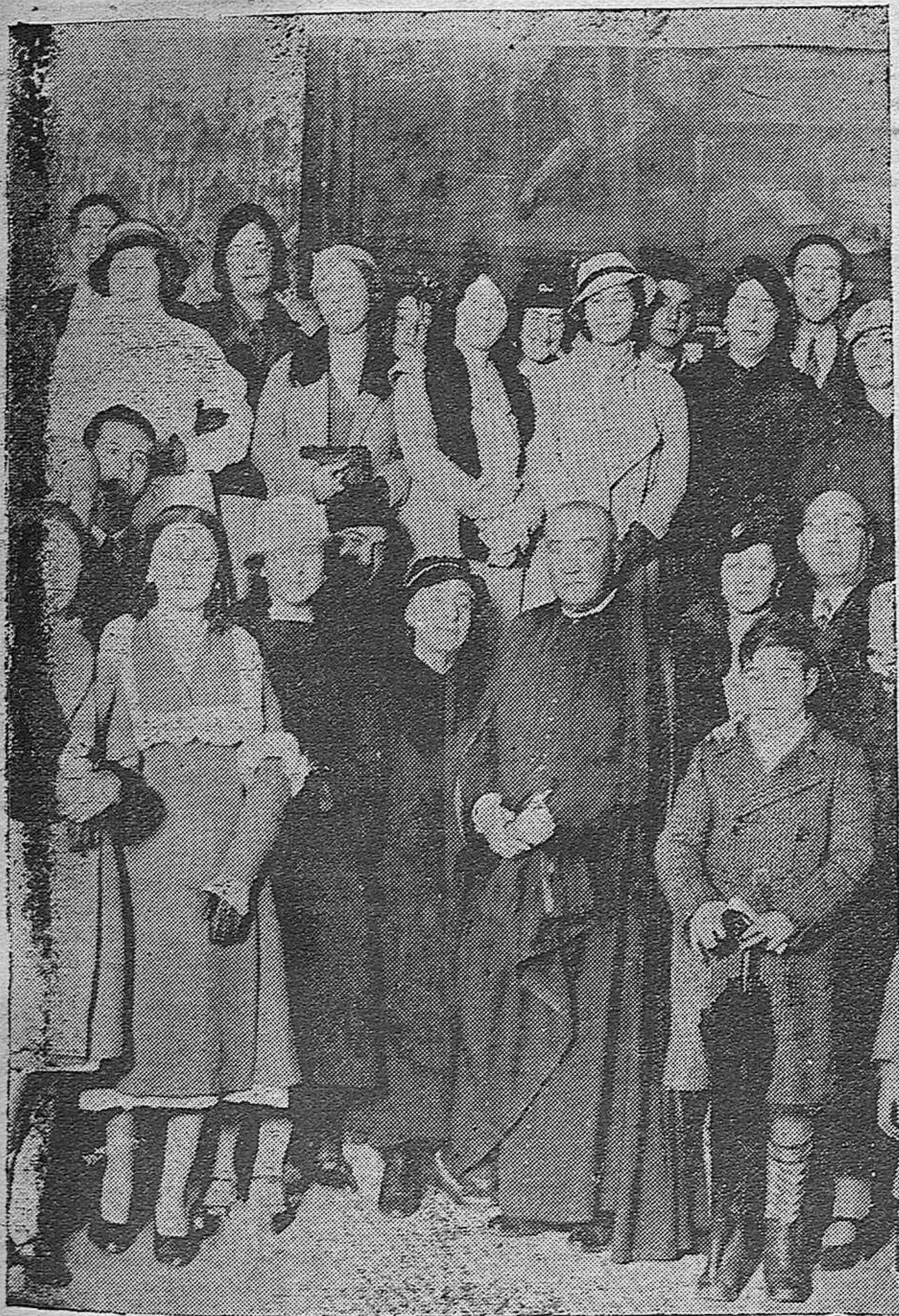
FIESTA EN EL CONSERVATORIO OFICIAL DE MUSICA.—Los alumnos de música pertenecientes a la F. U. E. que celebraron un concierto, en el cual tomó parte el emiente músico Abate Sexi.