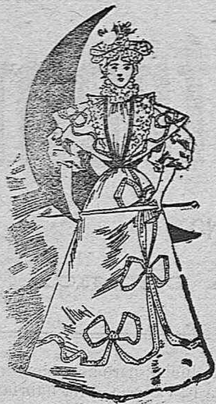
Traje para visita.

De seda tornasol; cuerpo entablado con una valona del mismo género, adornada con un pequeño bordado; volante de encaje; pechera y cuello de gasa; mangas forma globo. Falda forma campana, adornada con un bordado igual al del cuerpo.