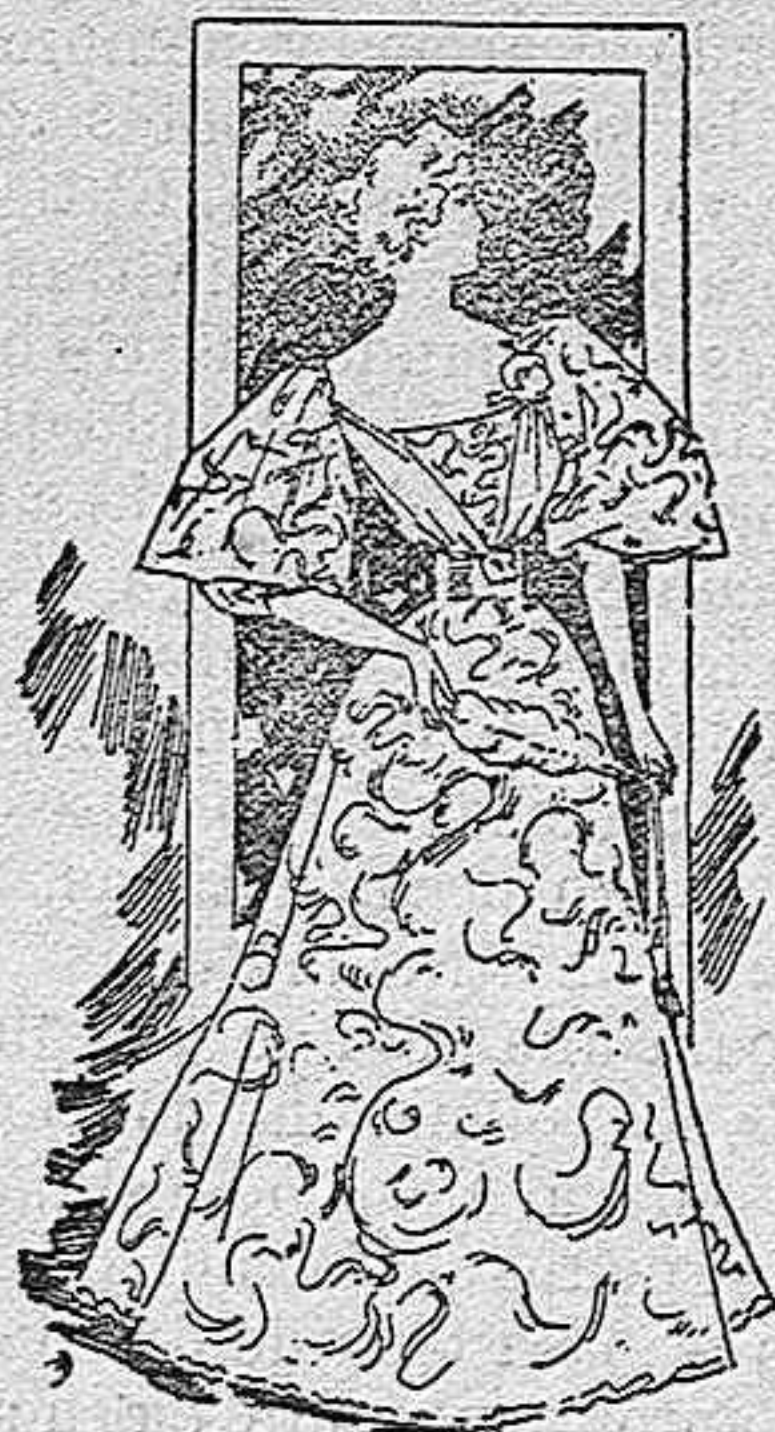
Traje para soireé

De lana lisa, color gris plata; cuerpo de seda tornasol, forma blusa con un cuello de puntilla guipur y un lazo de cinta de raso del color de la lana; mangas globo con puños del adorno; cinturón de cinta. Falda forma capa.