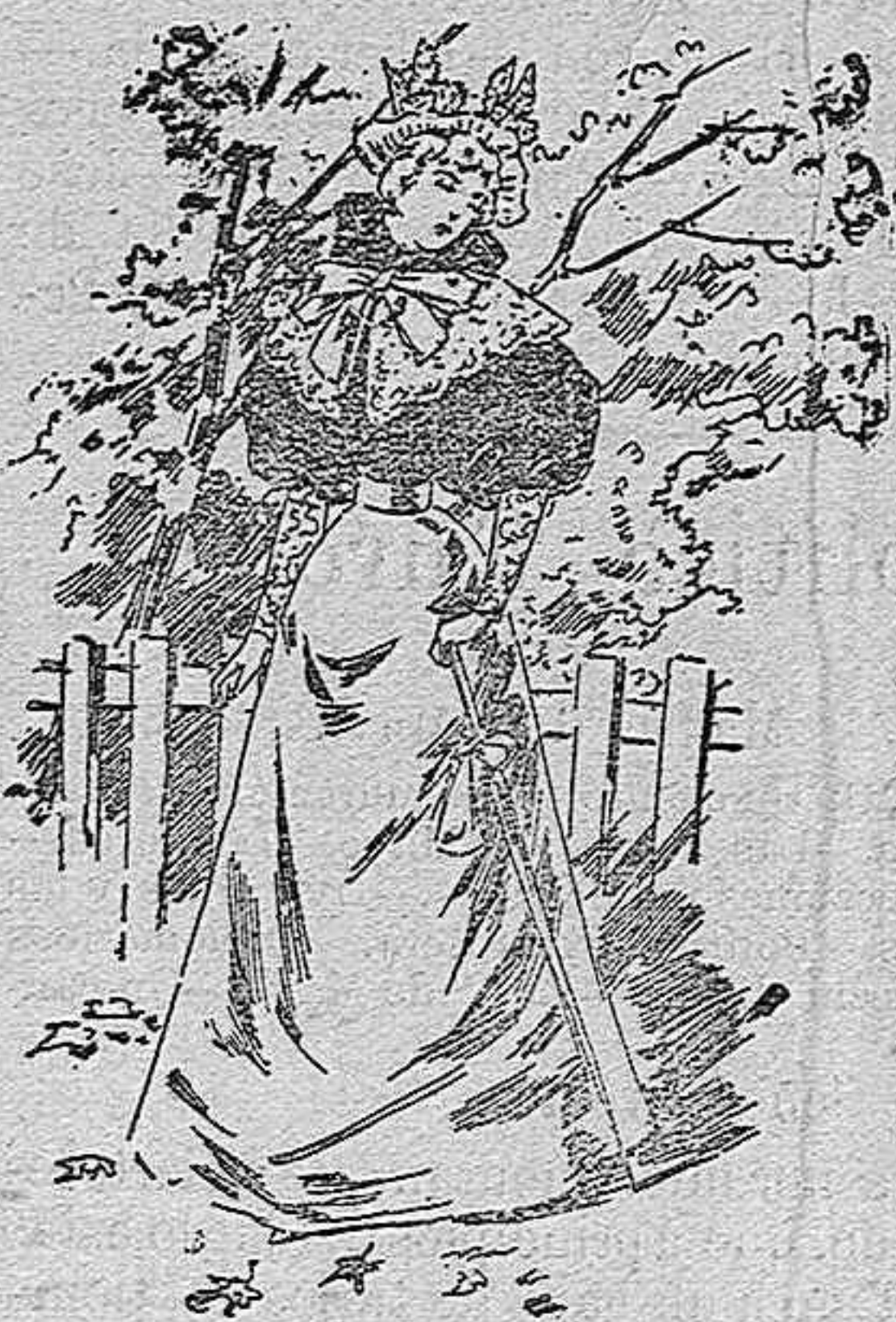
Traje para calle

De seda tornasol; cuerpo entablado con una valona del mismo género, adornada con un pequeño bordado; volante de encaje; pechera y cuello de gasa; mangas forma globo. Falda forma campana, adornada con un bordado igual al del cuerpo.