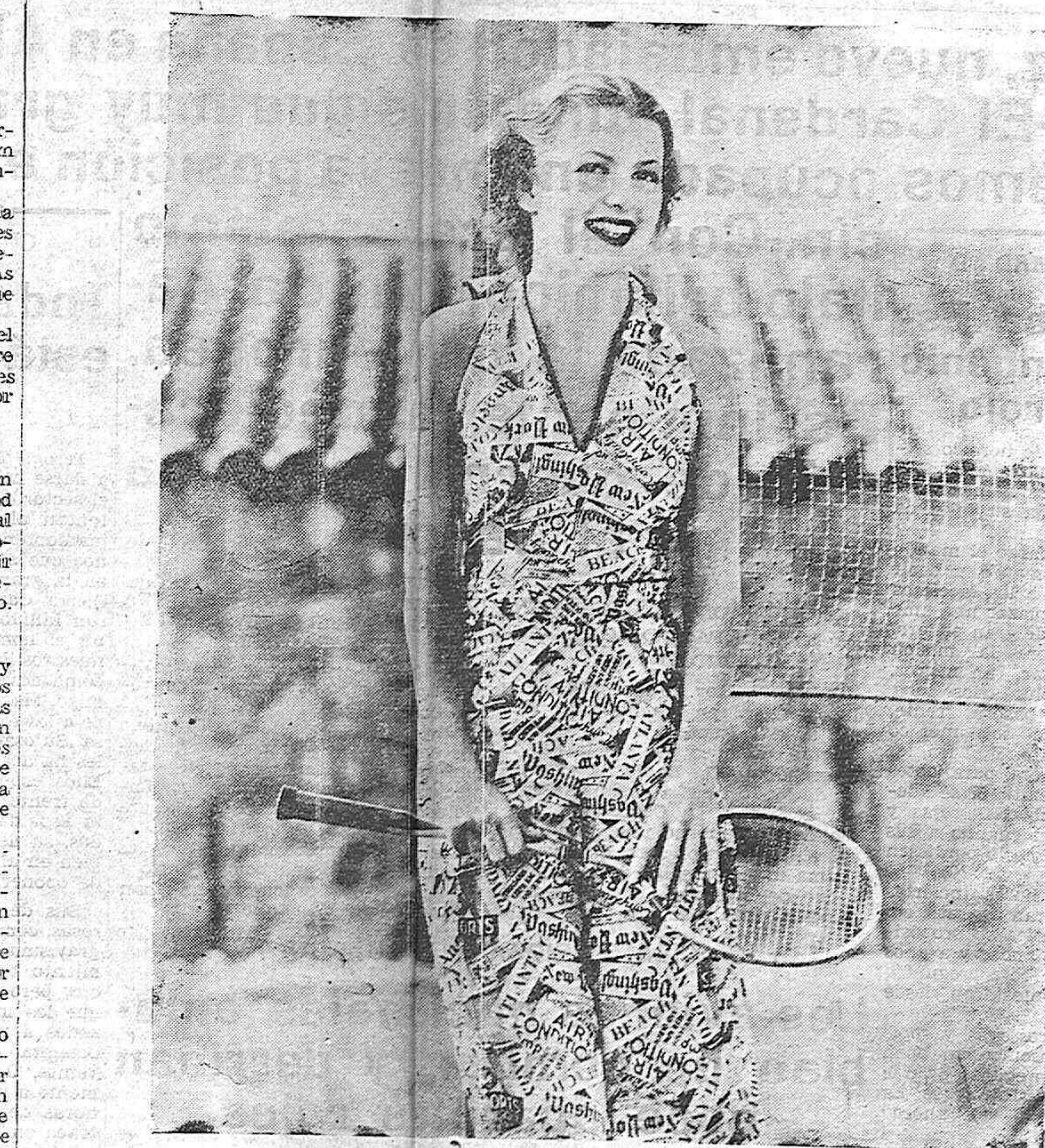
Betty Furnes, la gran artista del Cinema, en sus aficiones deportivas, usa un traje confeccionado con los titulares de los diarios norteamericanos. He aquí la original expresión de la simpatía de Betty Furnes por el periodismo.