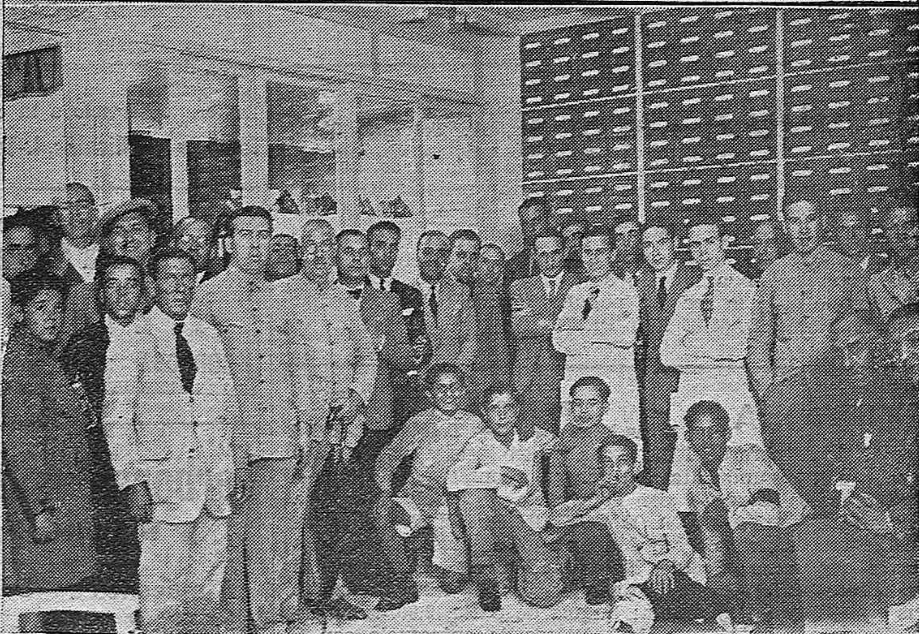
NOTAS GRAFICAS.—Asamblea de ingenieros de Caminos, Canales y Puertos de la Región Sur de España, celebrando después con este motivo un banquete en el Círculo de la Amistad.—Un detalle de la inauguración del comercio de calzados Ciudad del Betis celebrada anoche.