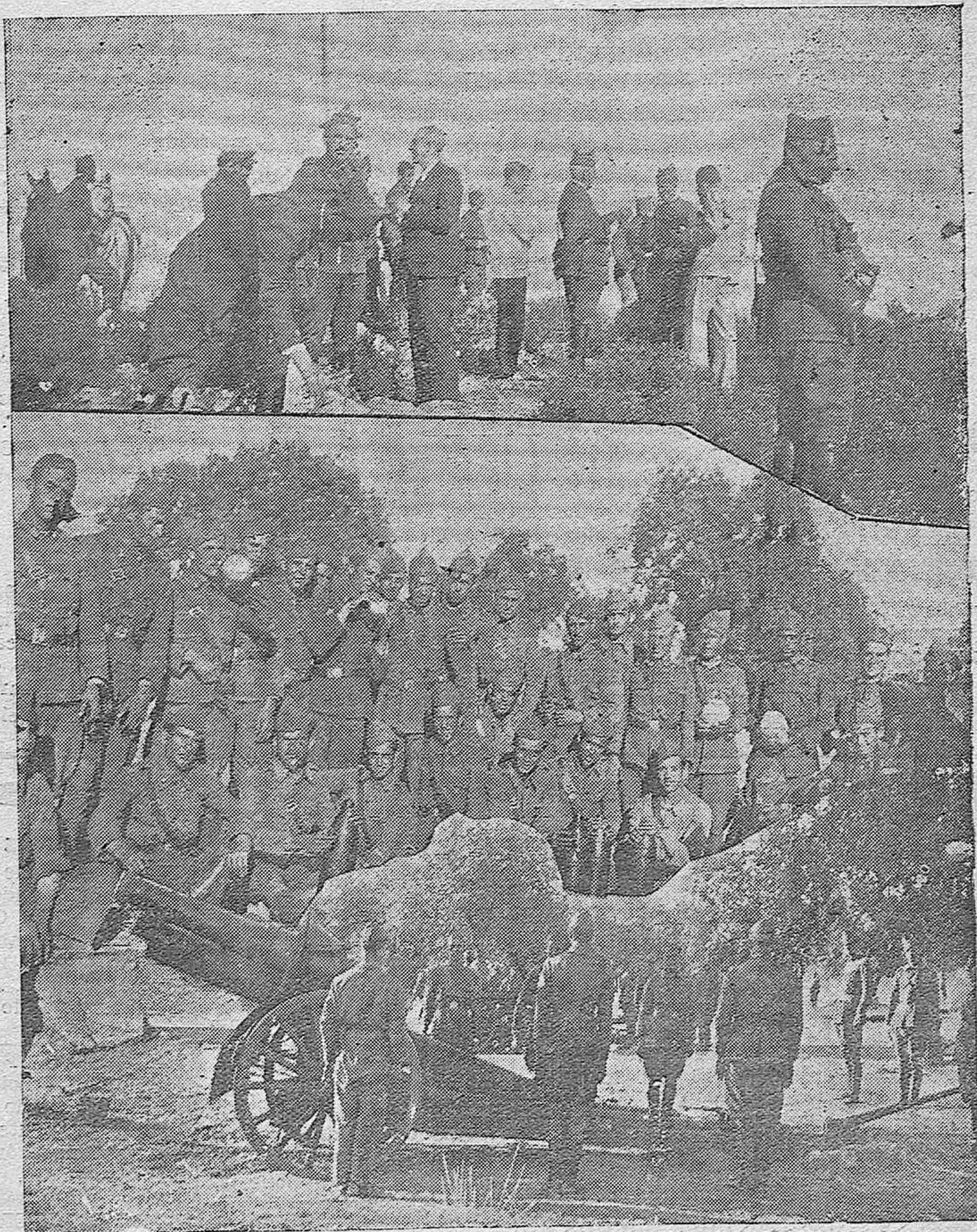
Las maniobras militares de Cerro Muriano.—El puesto del Estado Mayor presenciando las maniobras de conjunto.—La Artillería durante el ejercicio táctico.—Grupo de artilleros preparando las espoletas.