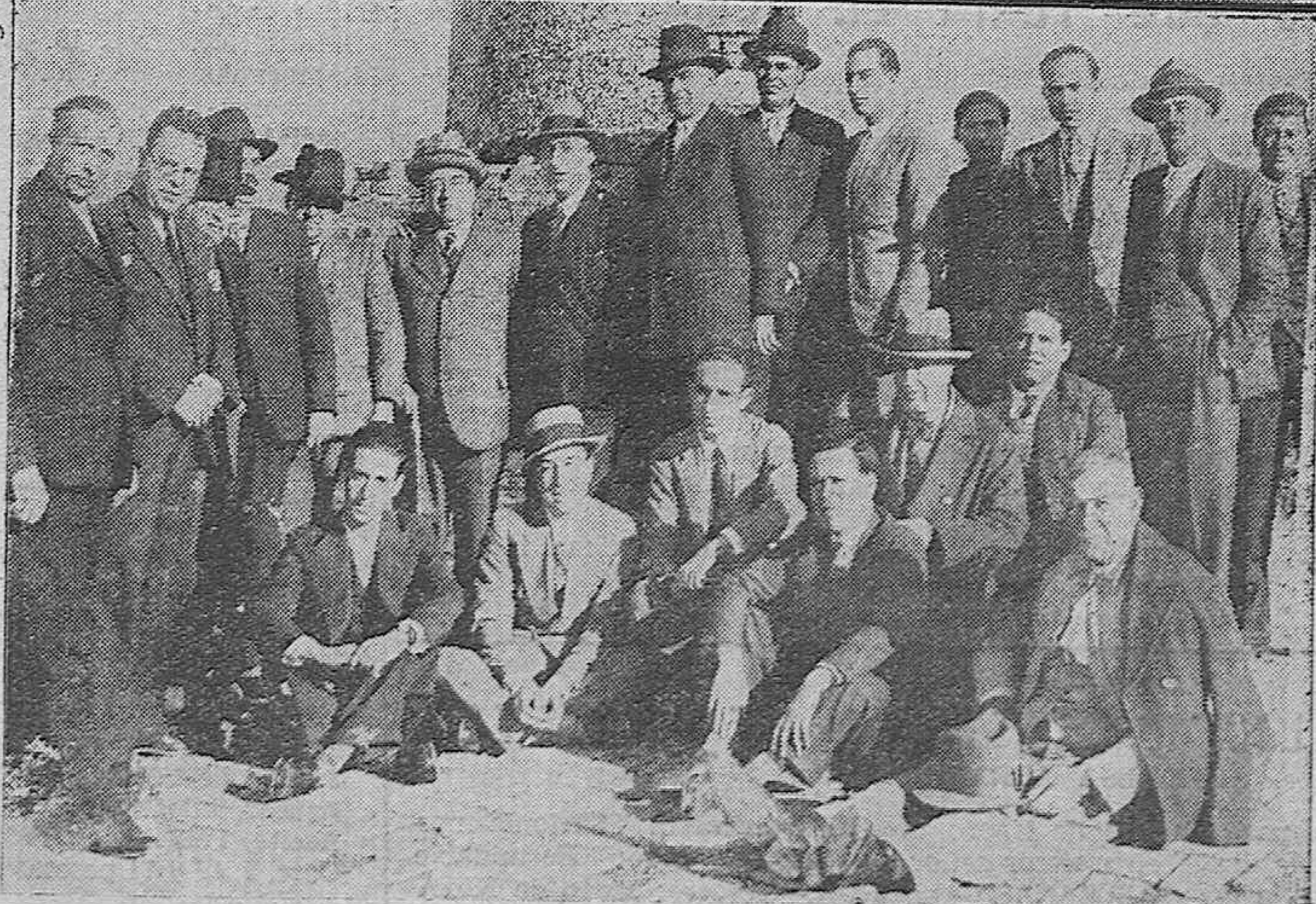
Arriba: Presidencia y alcaldes con las comisiones de varios pueblos durante la reunión celebrada en Pedro Abad.—Abajo: El gobernador civil señor Gardoqui, con el presidente de la Diputación don Pablo Troyano, y otras personalidades durante la excursión al histórico Castillo de El Carpio.