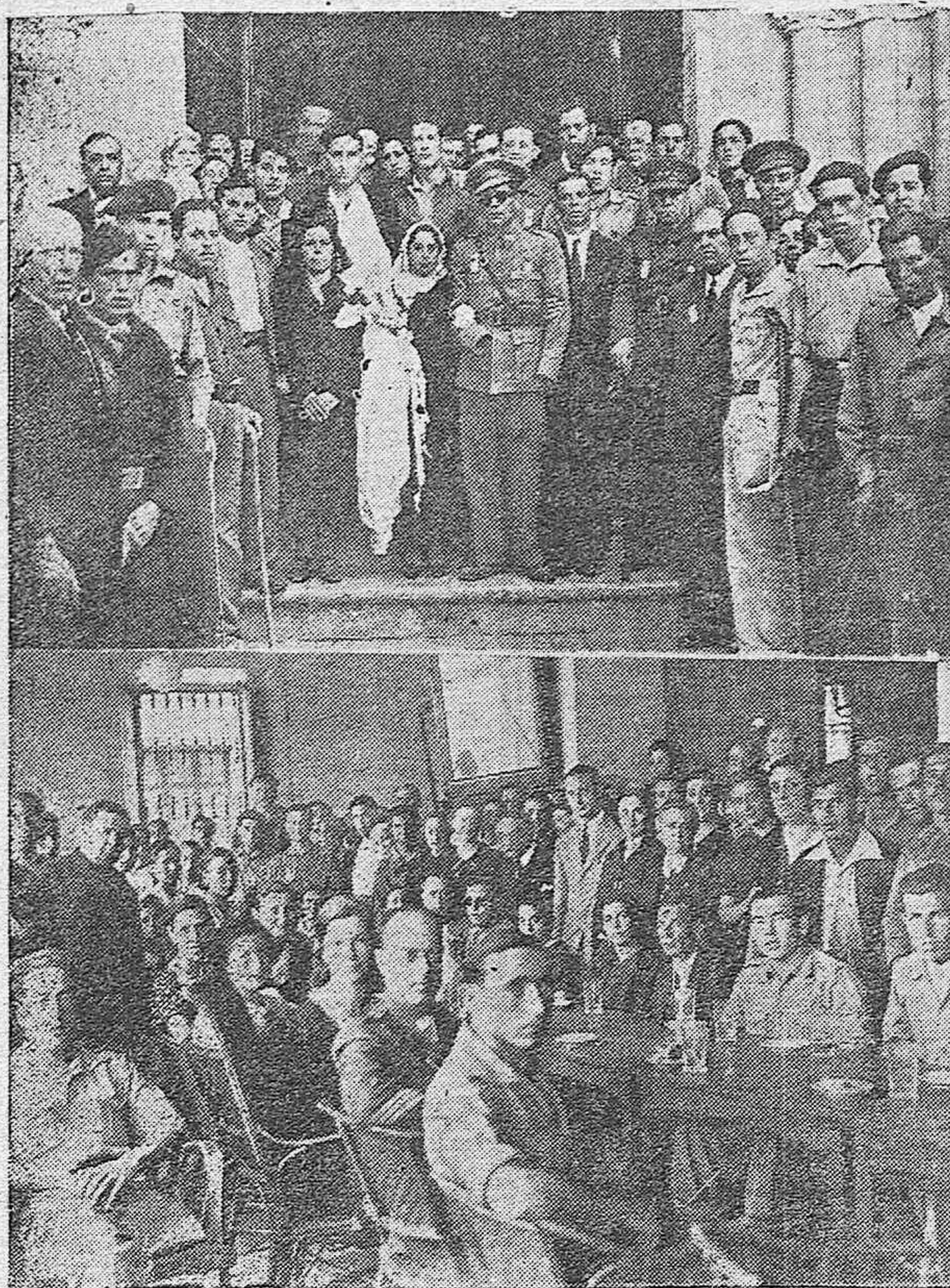
El nuevo matrimonio al salir del templo.—En el Hogar del Herido, donde fueron obsequiados el nuevo matrimonio y los mutilados concurrentes, por las señoras y señoritas de la Asistencia a Frentes y Hospitales.

El domingo en la Parr. quia de San Miguel