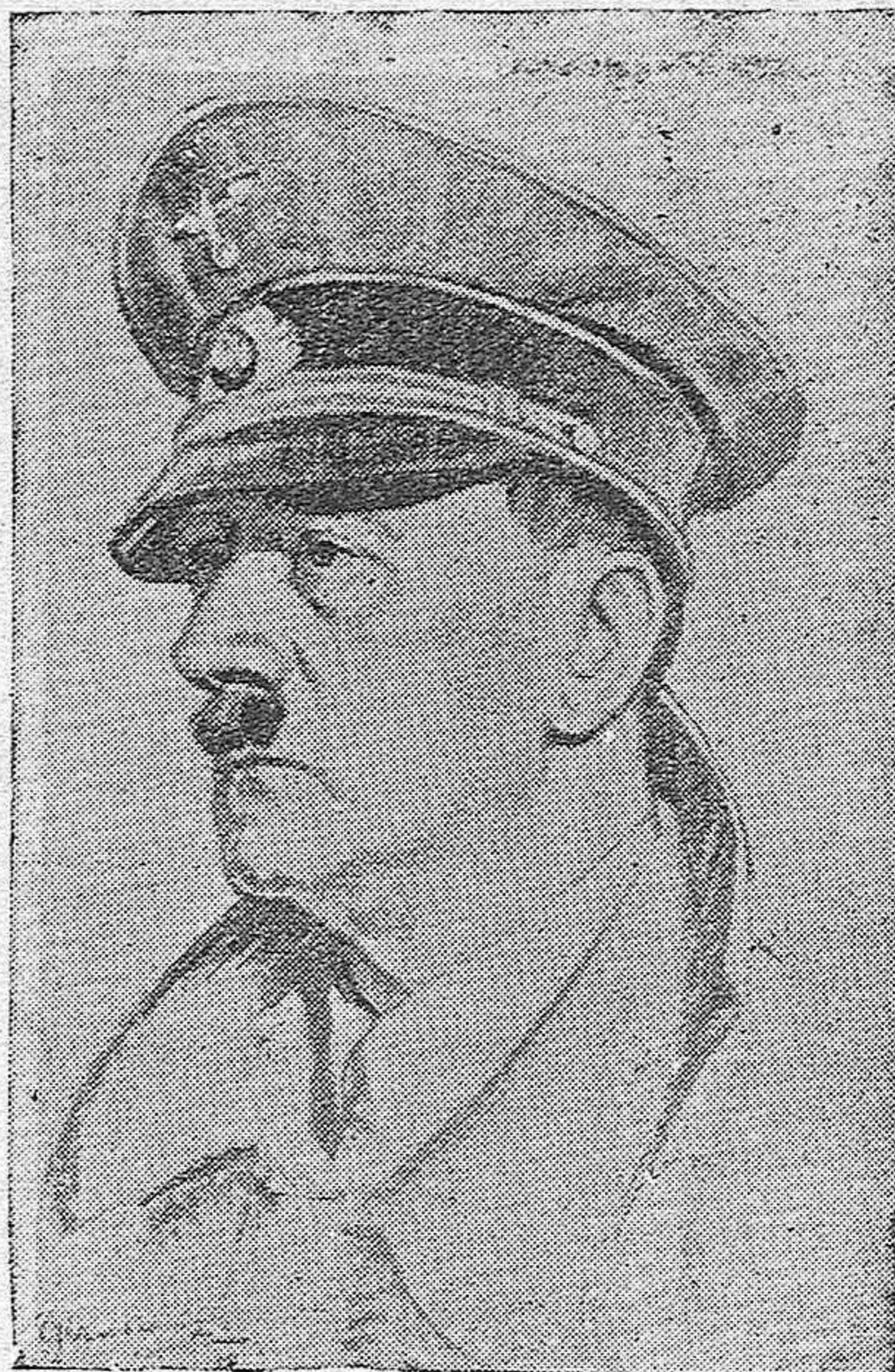
Hitler, el Führer de Alemania, que hoy cumple cincuenta años.