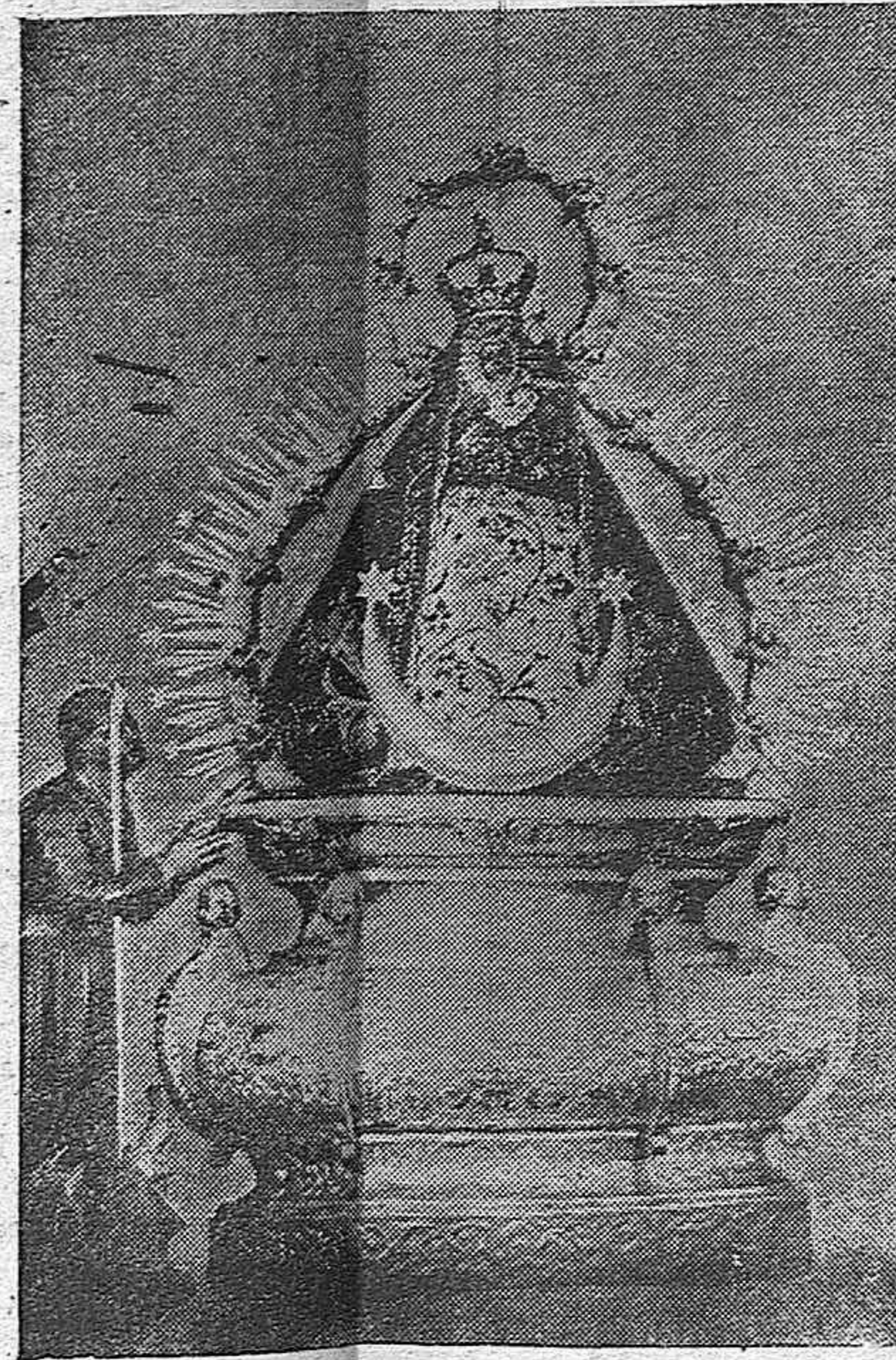
NUESTRA SEÑORA DE LA CABEZA.

Pena e indignación produce en todo sentimiento noble el relato minucioso que de aquellos días de ansiedad y esperanza nos ha hecho el Guardia Civil evadido. Repetirlo nosotros aquí, sería tanto como pasar por la retina del lector la serie de epi-