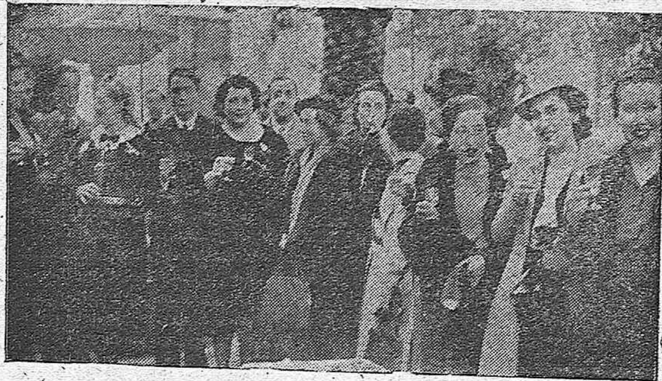
LOS TURISTAS ITALIANOS DURANTE SU VISITA A LAS BODEGAS DE MORA, EN LUCENA.

de vinos de los Herederos de don José Mora, donde fueron espléndidamente obsequiados con sus selectos caldos, dulces y aperitivos, reinando la mayor animación, siendo despedidos en la Plaza Nueva, donde la