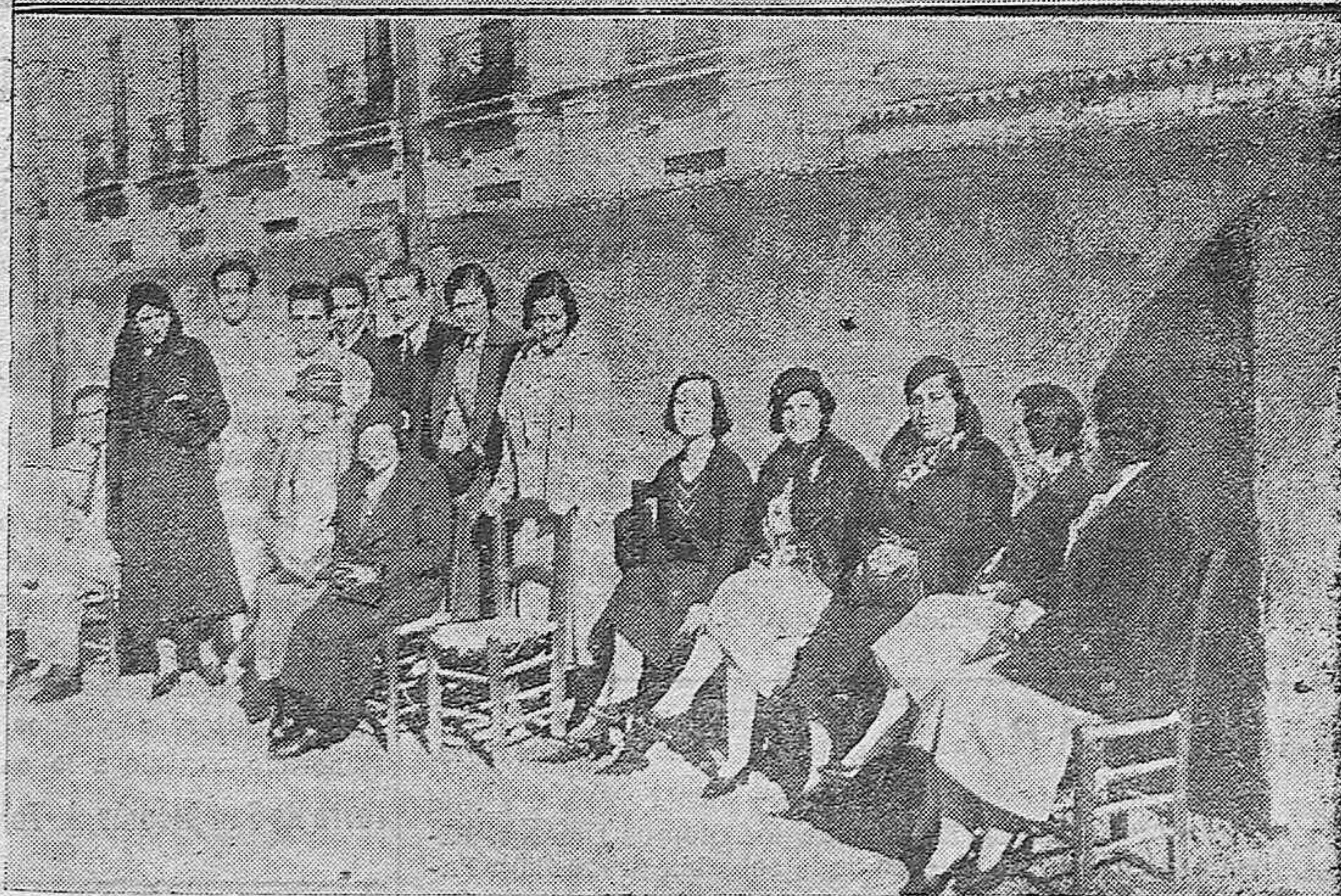
NOTAS GRAFICAS.—Grupo del equipo inglés con la selección cordobesa que tomaron parte en la jugada del domingo.—Grupo de señoritas presenciando la interesante jugada.