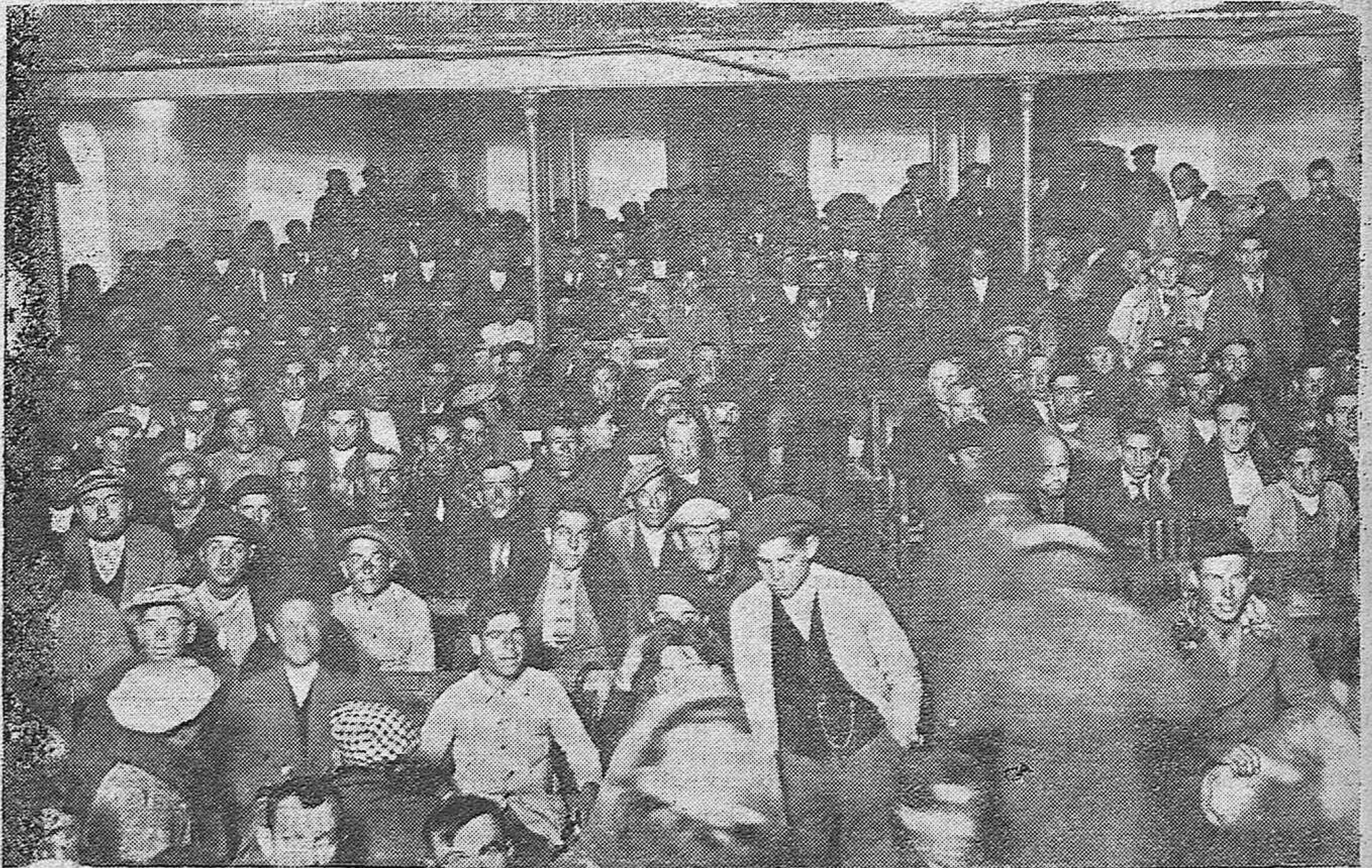
Aspecto del Teatro principal de Fuente Obejuna durante el importante mitin celebrado anoche por la Conjunción Republicana Cordobesa.

La boda se ha fijado para los primeros días de Diciembre.