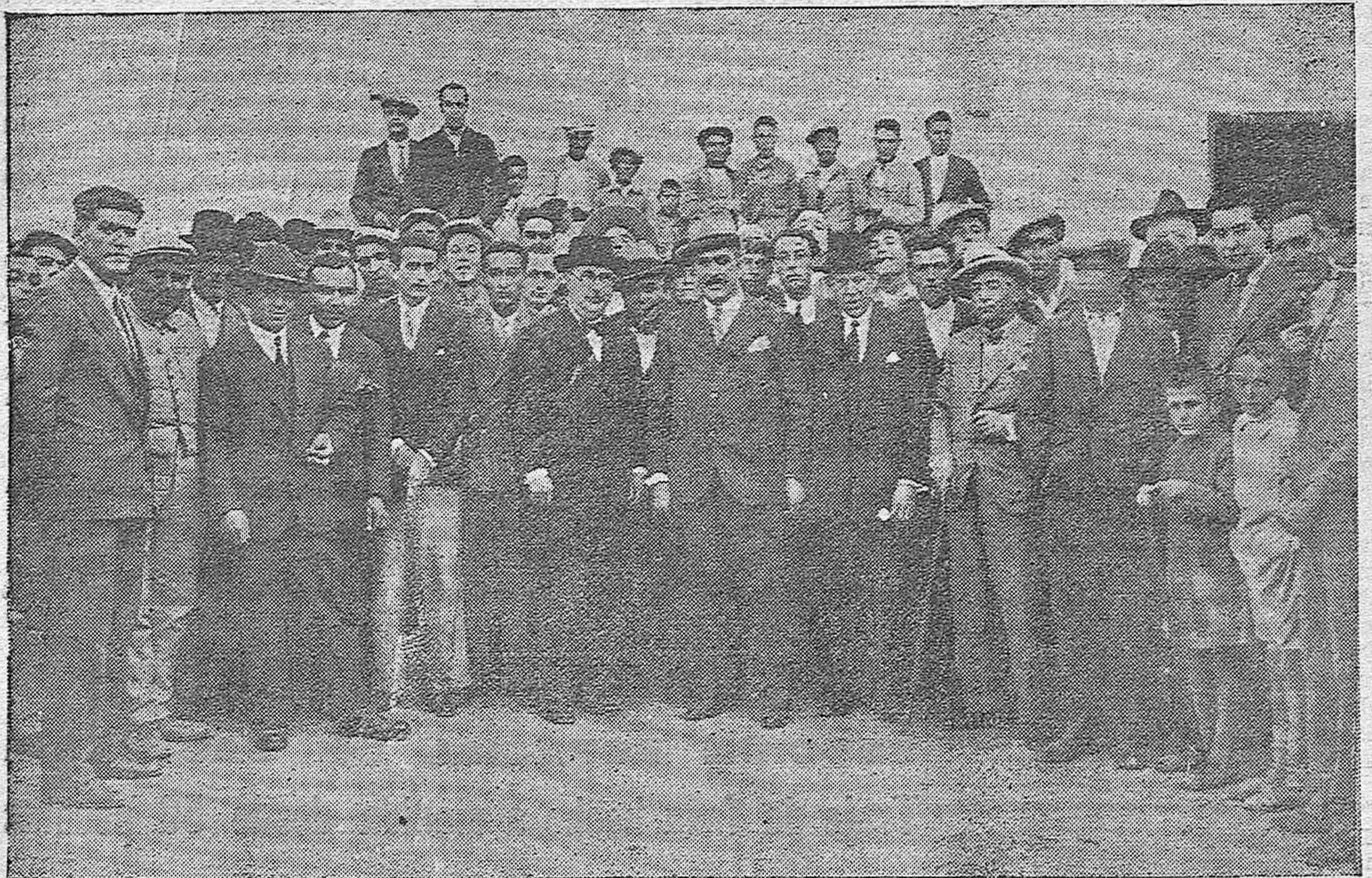
SANTAELLA.—Candidatos de la coalición republicana, después del interesante acto electoral.

"CABALGATA" dice el DAILY NEWS, de Nueva York: "Cuatro artistas... Una realización cumbre. Profundamente hermoso. Emocionante."