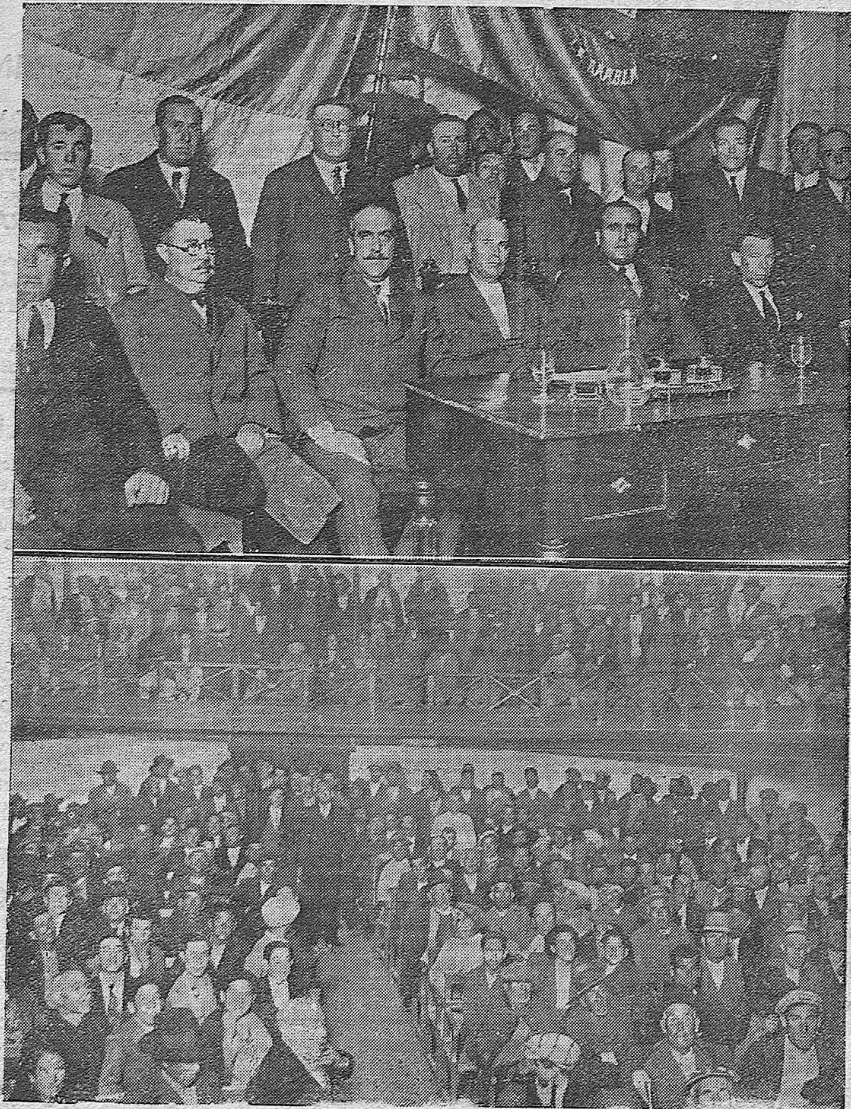
NOTAS GRAFICAS.—El acto político de la Rambla.—Oradores que tomaron parte.—Vista del teatro durante el acto.