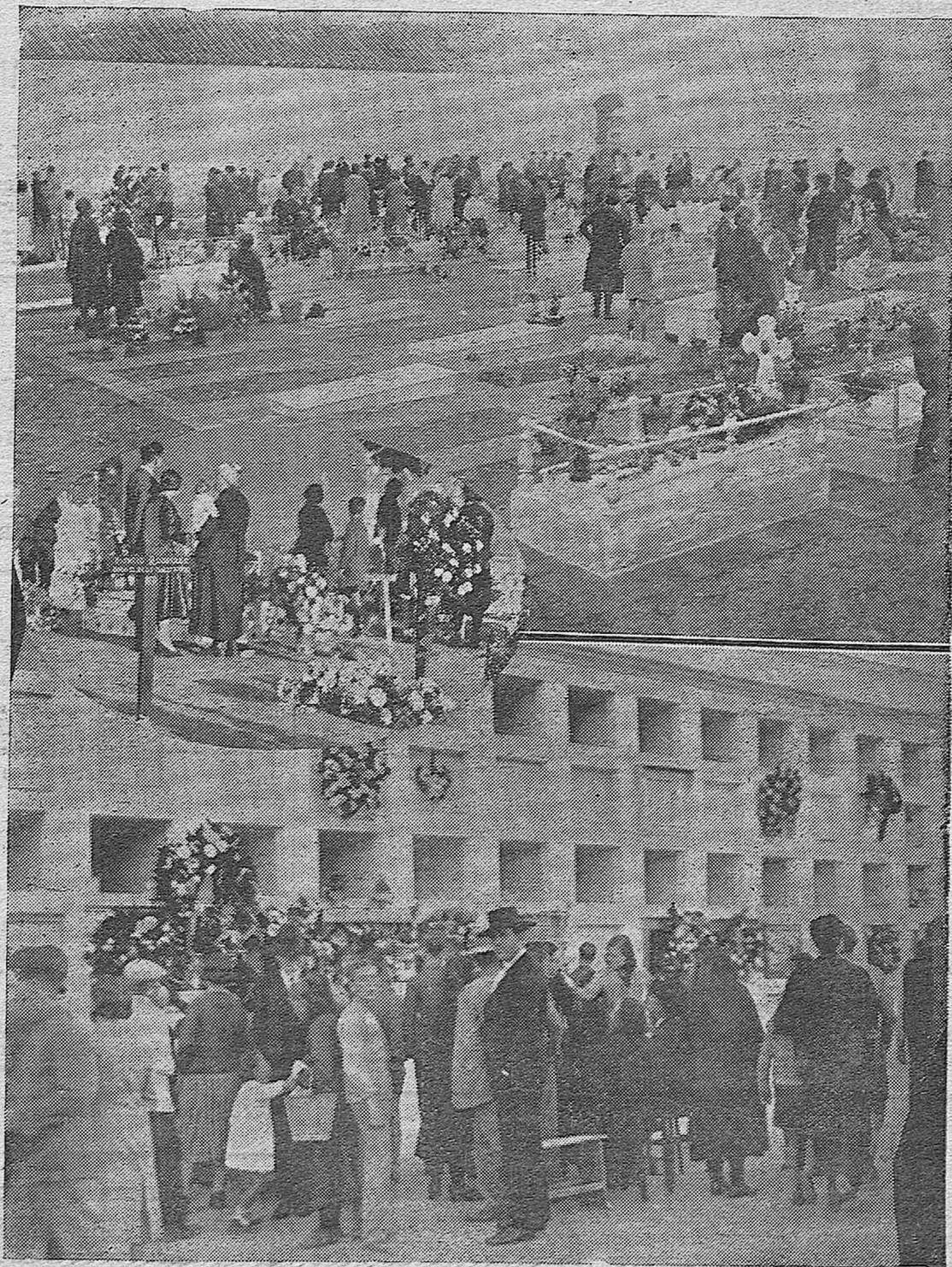
NOTAS GRAFICAS.—Varios aspectos de la visita a los cementerios de la capital, durante el día de ayer