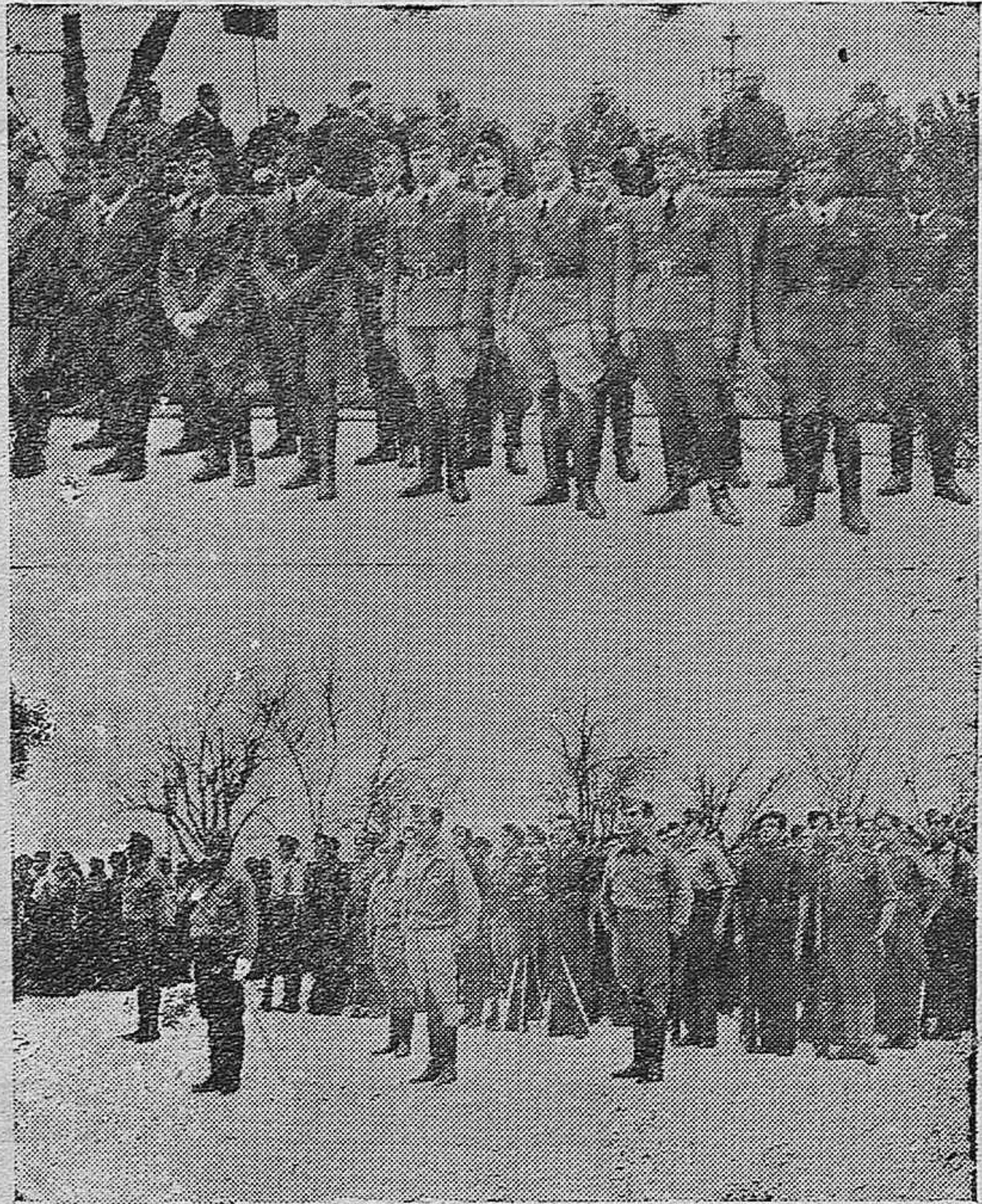
La Jura de los alumnos A féreces de Granada en el Paseo de la Victoria de Córdoba, fué un acto brillante. Dos aspectos de dicho acto.