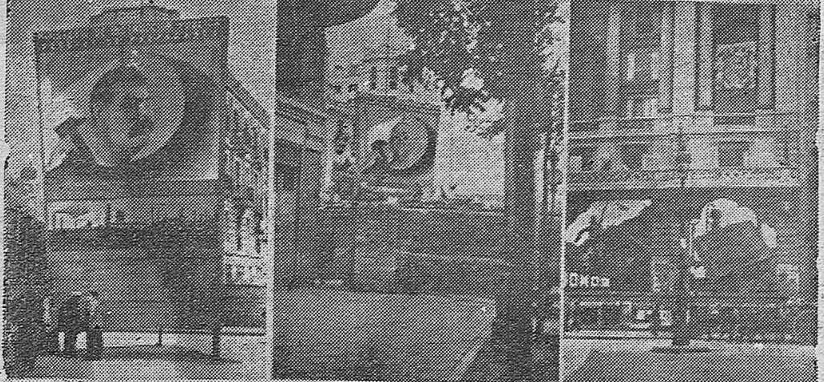
Algunas de las muchas conmemoraciones alzadas en las calles o esquinas de las fachadas como homenaje del pueblo de Madrid a la Unión Soviética en el XX aniversario de la Revolución rusa.