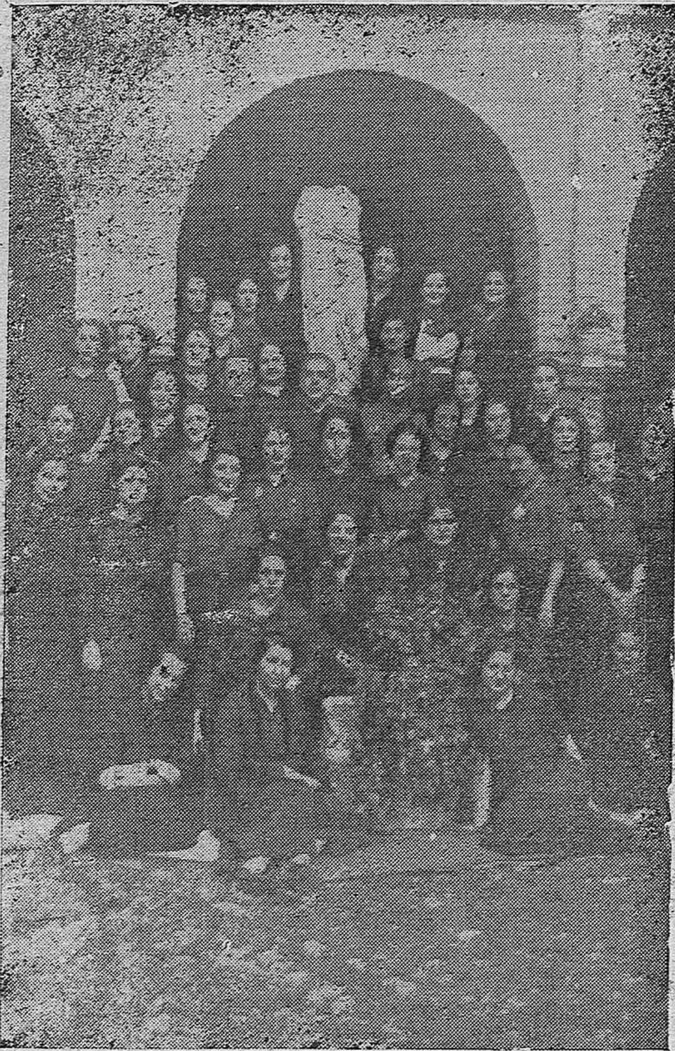
Primera promoción de enfermeras de AUXILIO SOCIAL aprobadas en los cursillos, y cuyos exámenes se han verificado en el Instituto de Córdoba.

DIARIO DE FALANGE ESPAÑOLA TRADICIONALISTA Y DE LAS J. O. N. S.