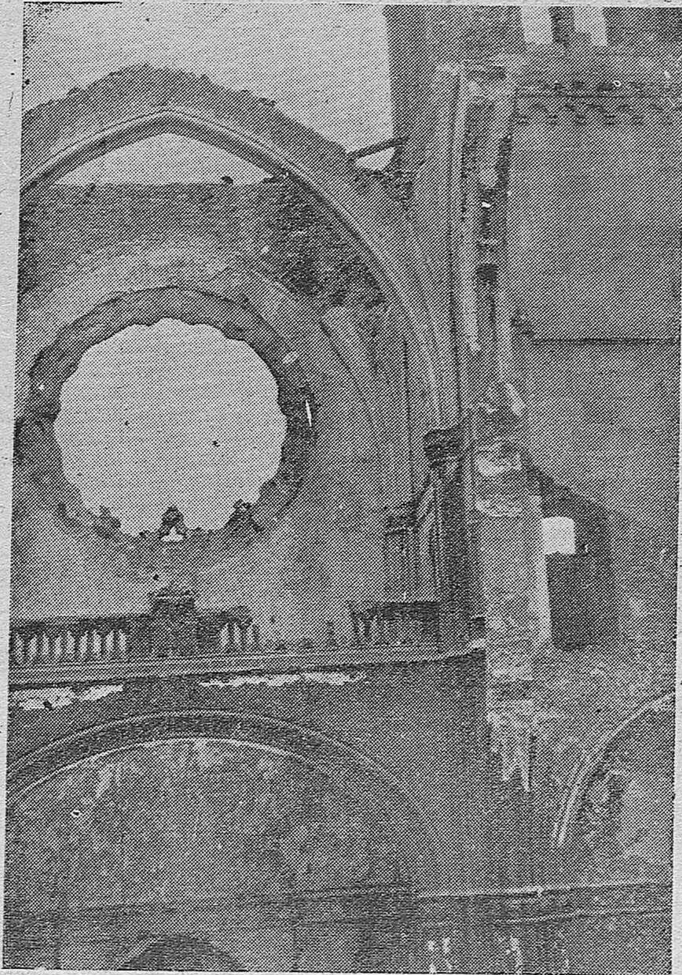
Interior de una iglesia, después de la obra destructora de los rojos en Asturias.