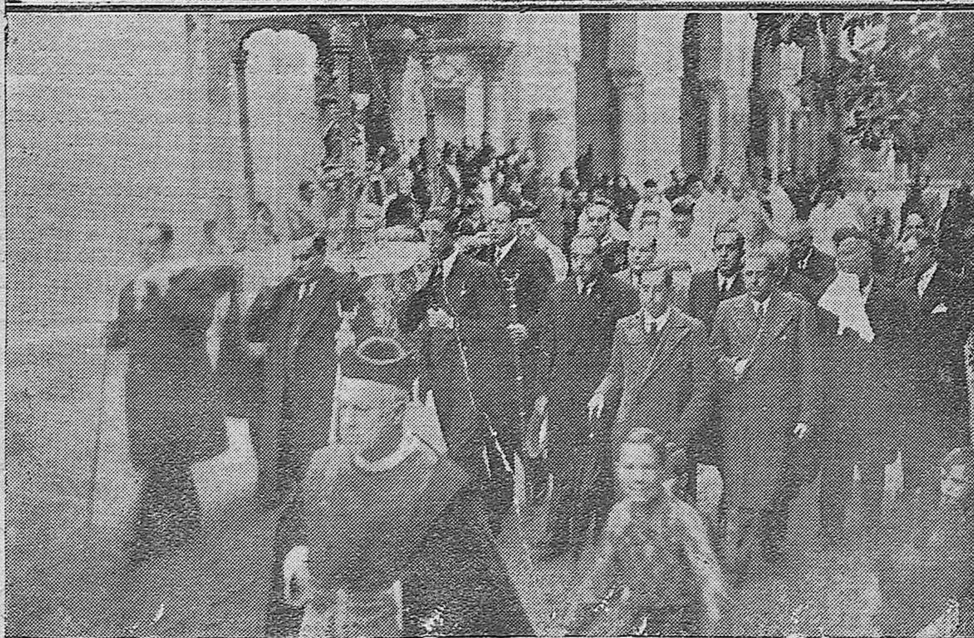
Dos aspectos de la procesión celebrada por el exterior de la Catedral con motivo de la festividad del día.