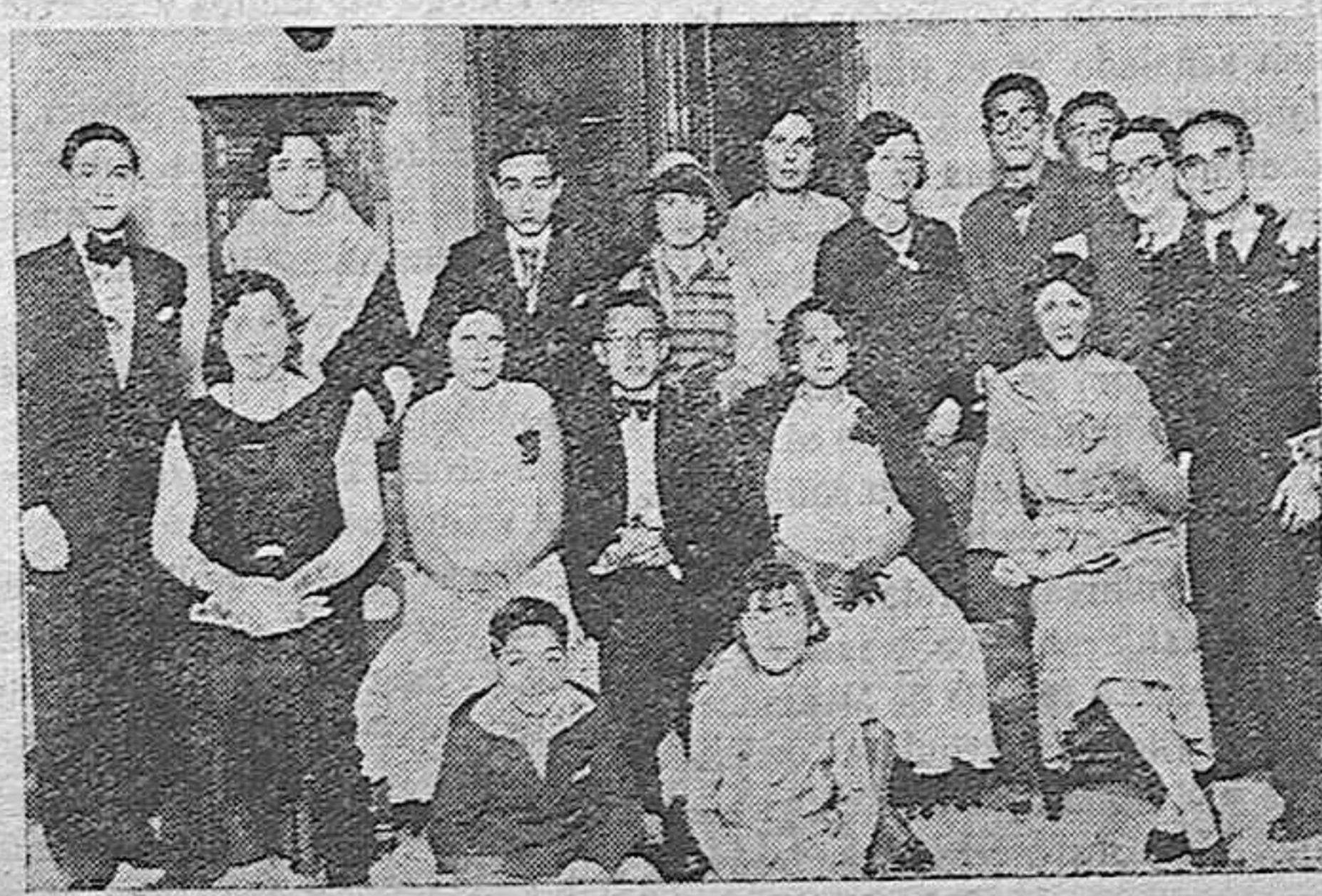
En el Conservatorio Oficial de Música se celebró ayer tarde el ejercicio escolar, primero del actual curso. Distinguidos alumnos que tomaron parte en él, asistiendo los familiares de los alumnos matriculados en el Centro.