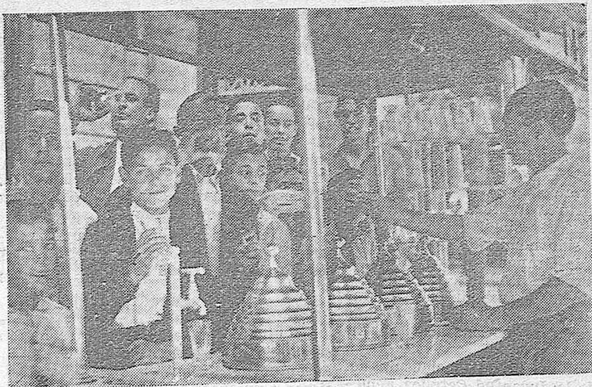
"El público con sed insaciable consume el rico producto"

Este año, como siempre vinimos, con el sano deseo y el afán de servir al público cordobés, pero usted ya sabe el presupuesto tan elevadísimo con que hemos tropezado.