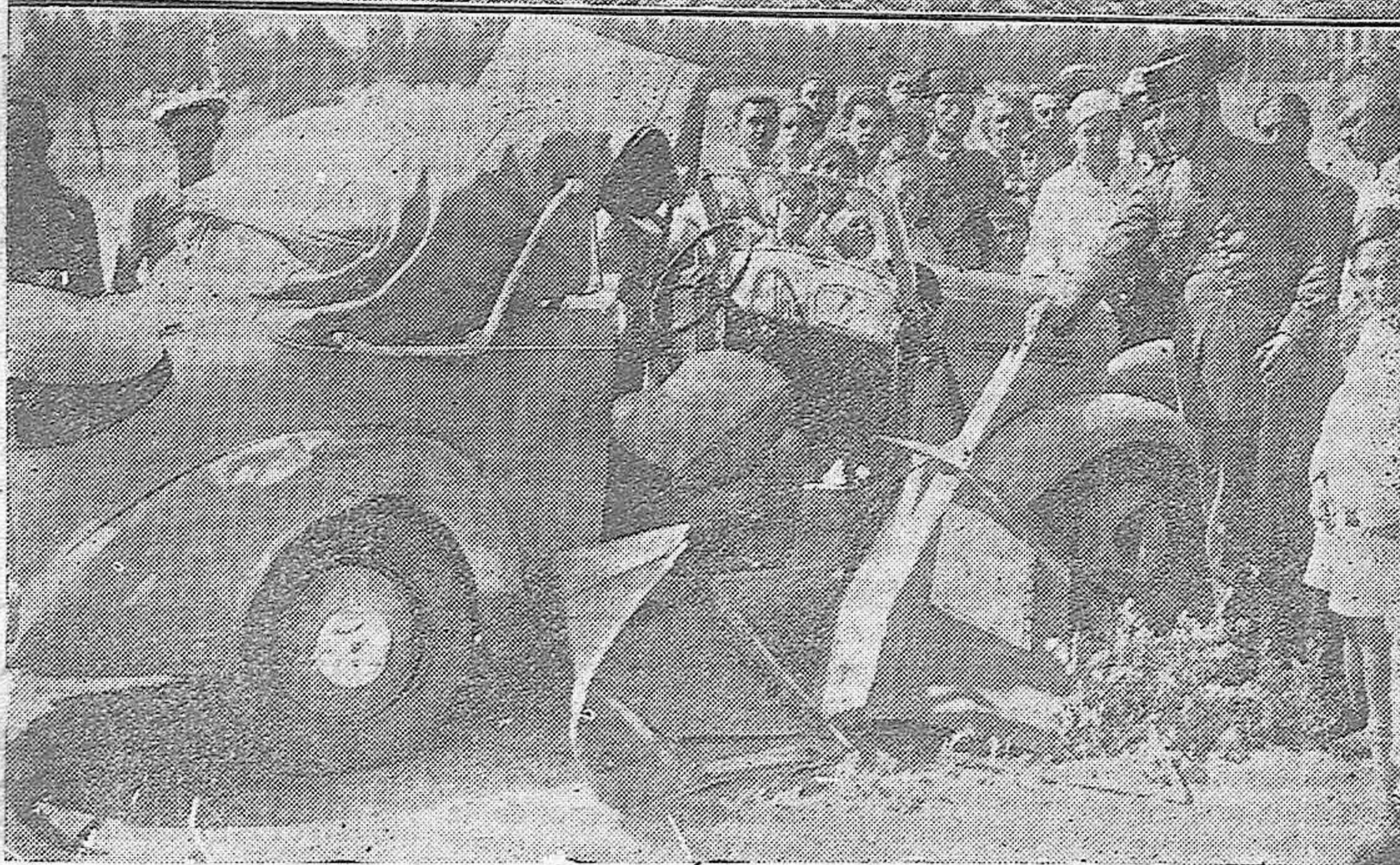
Arriba: Grupo de estudiantes de Veterinaria, que han terminado la carrera.—Abajo: Estado en que quedó el automóvil, que sufrió un accidente en las inmediaciones de la Electromecánica. Una de los ocupantes del vehículo resultó muerta y el resto heridos.