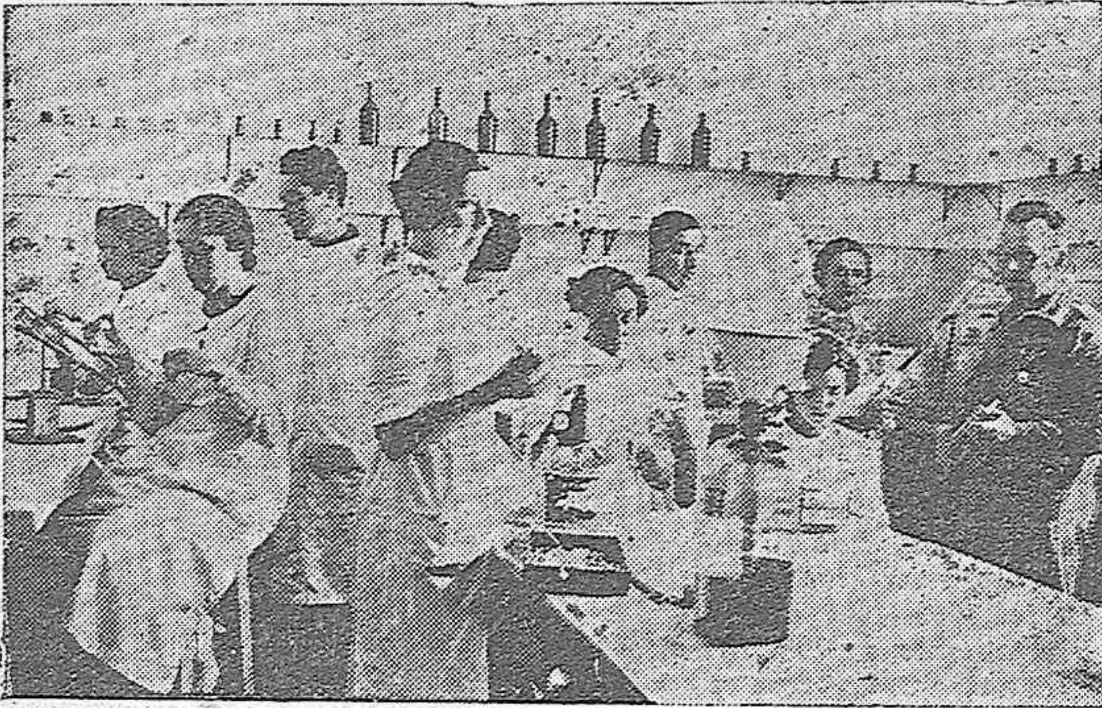
En el laboratorio del Hospital Militar la mujer española presta sus servicios con un noble afán patriótico.