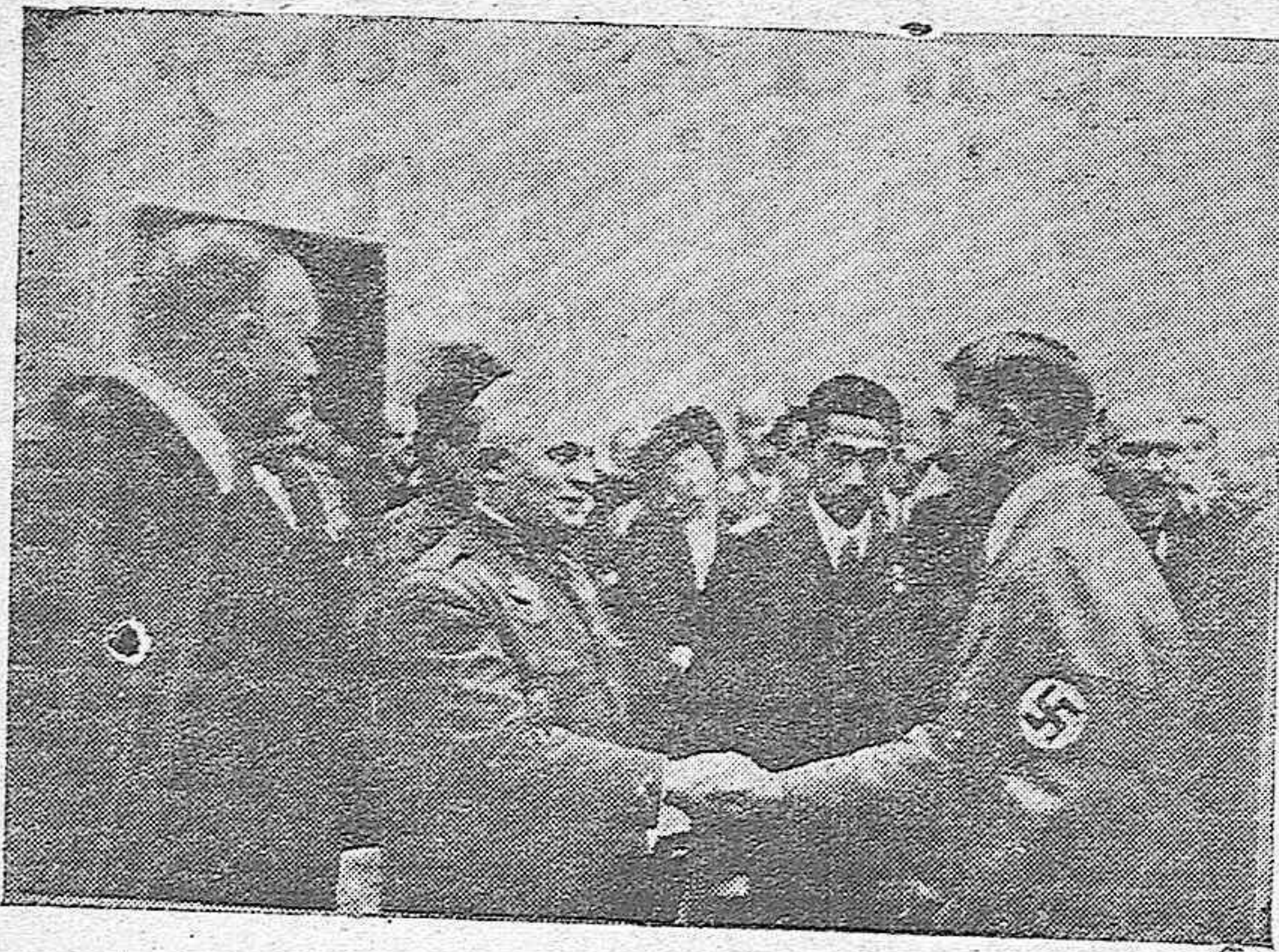
El general Espinosa de los Monteros es saludado por el Führer Canciller, en Nuremberg.