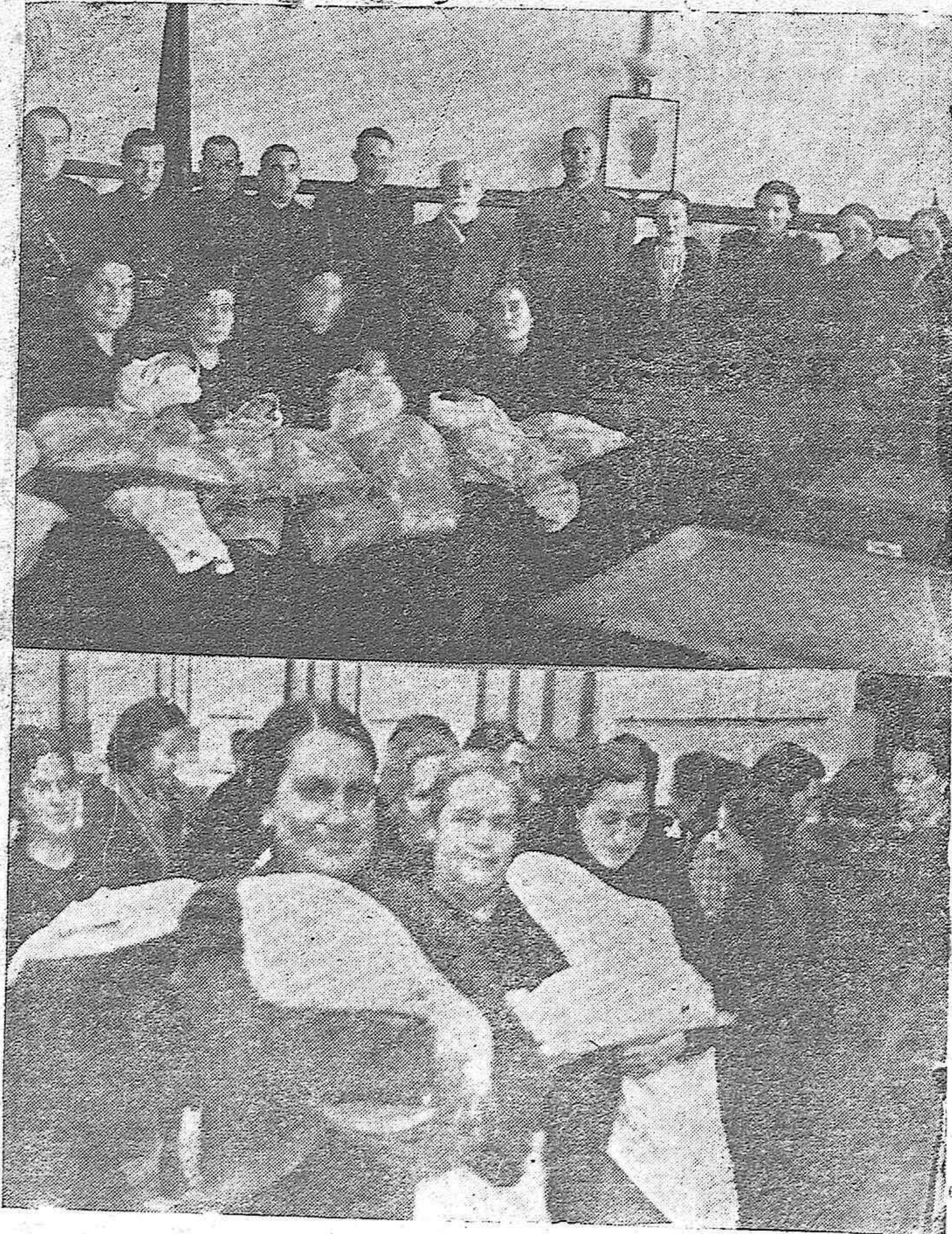
En la Delegación de "Auxilio Social" se hizo entrega de las canastillas de ropa a las madres de los niños que nacieron en Córdoba el día de Nochebuena.