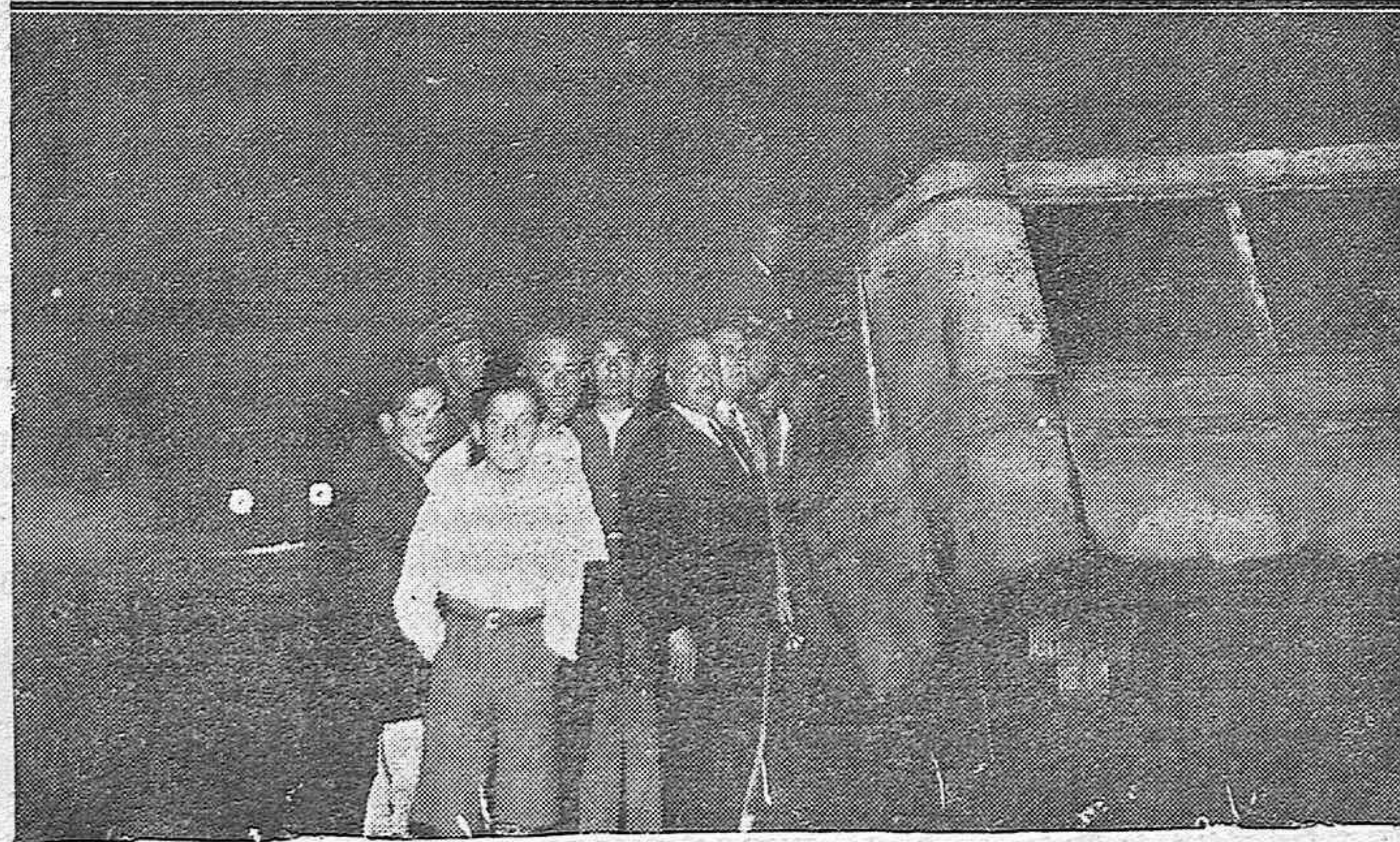
Los detenidos por la guardia civil que incendiaron el autobús de la Sierra en el Brillante.—Una vista del autobús hecha poco después de comenzar a arder, al acudir los bomberos el 15 de Julio del año actual.