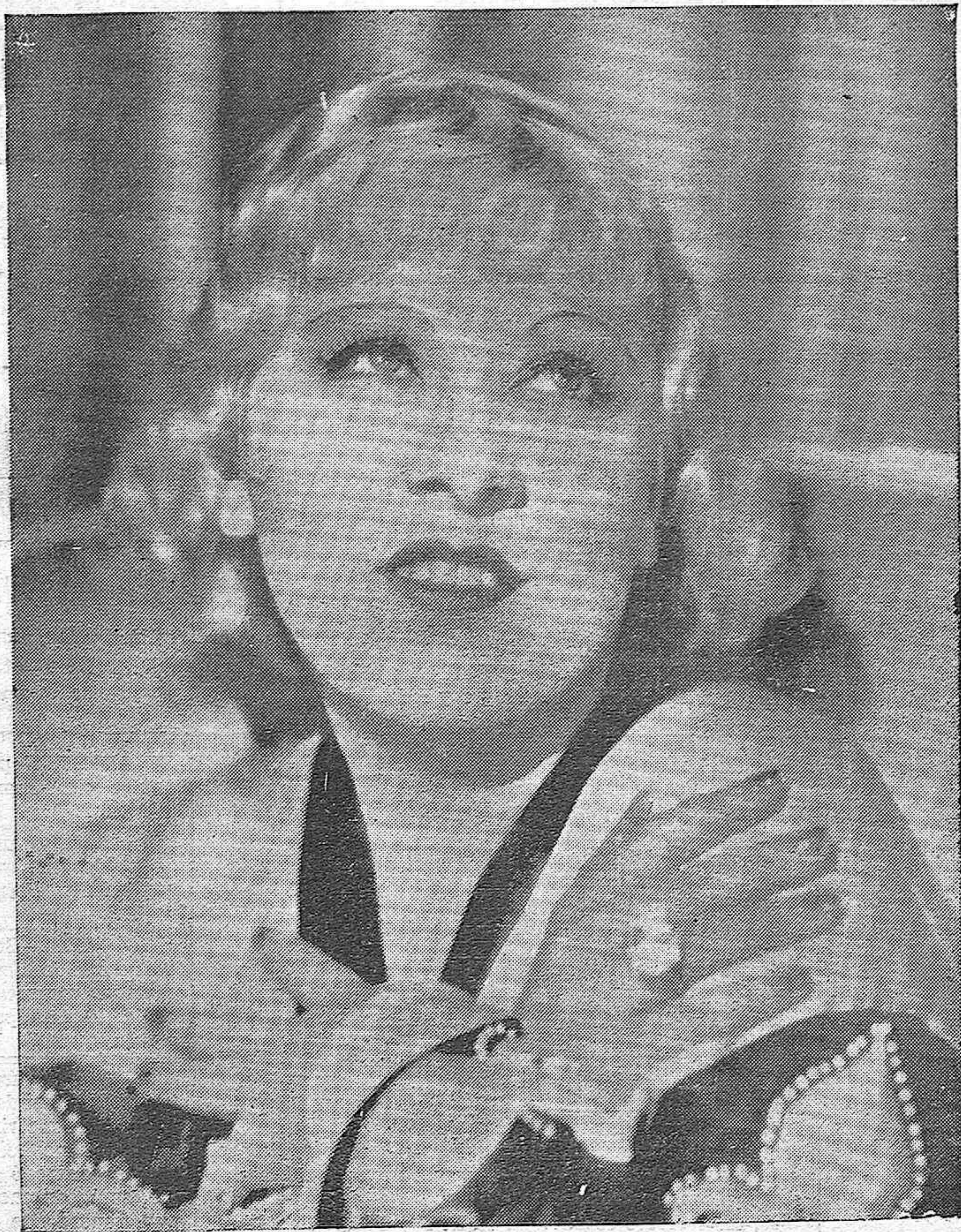
MAE WEST. la sugestiva actriz de la Paramount, protagonista de la hermosa película "No soy ningún ángel"