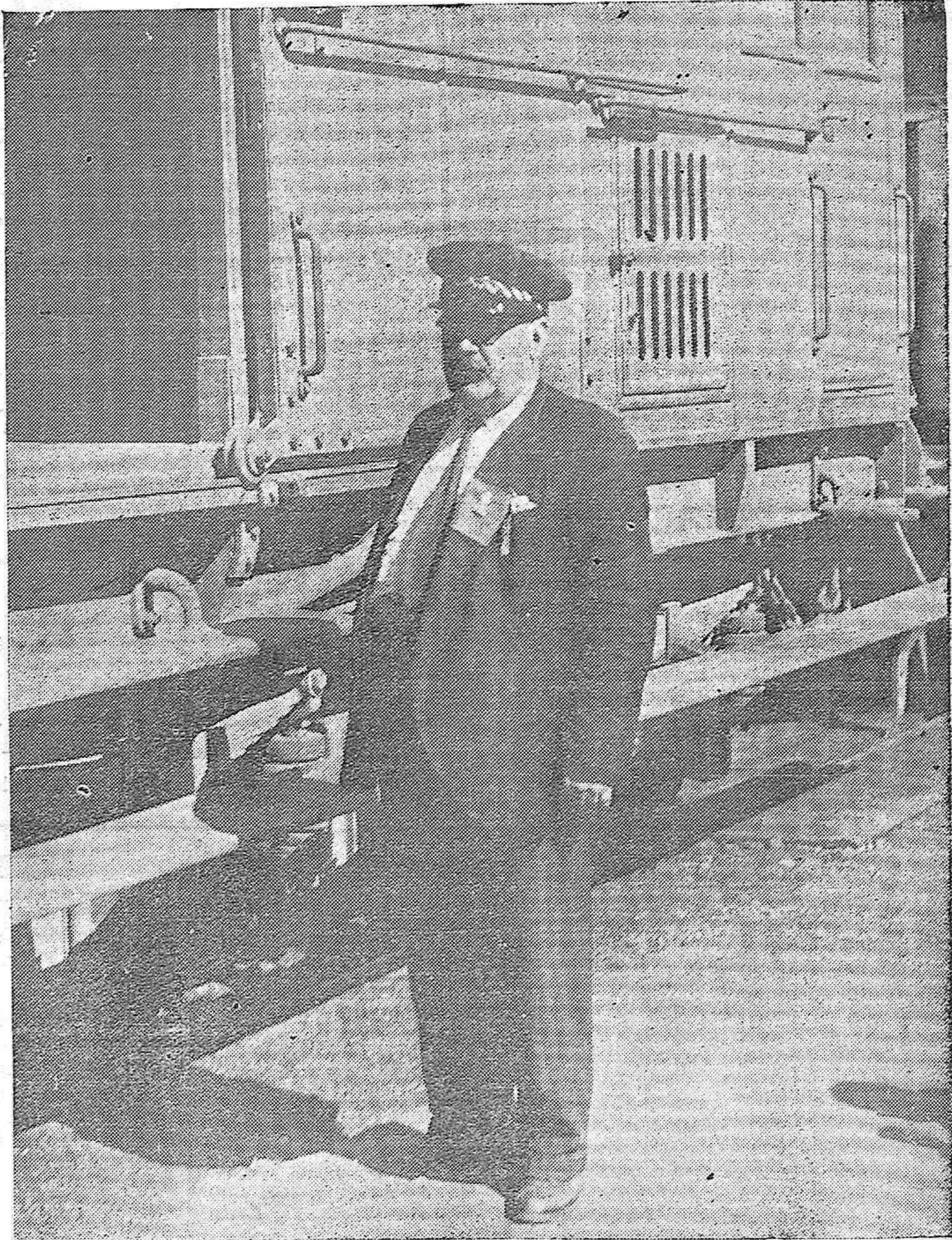
Militarización de los ferroviarios. —Uno de los primeros empleados de la Compañía en la Estación Central que luce su distintivo militar consistente en una bayeta amarilla con el emblema de ingenieros.