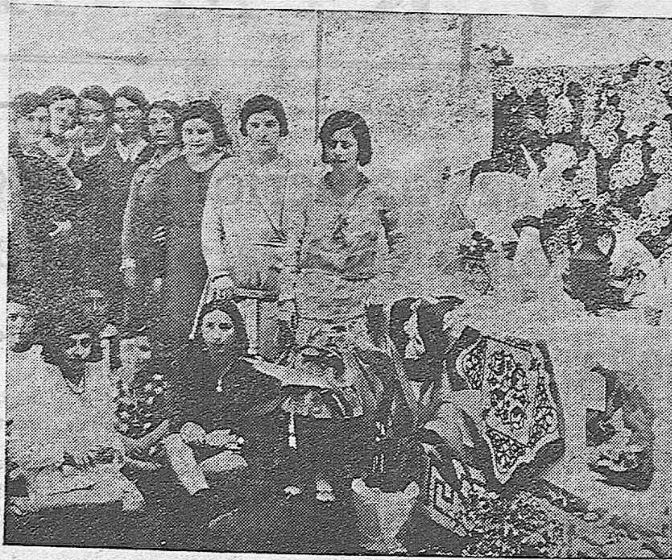
Clausura de la Exposición de Labores de las alumnas de mencionado Centro