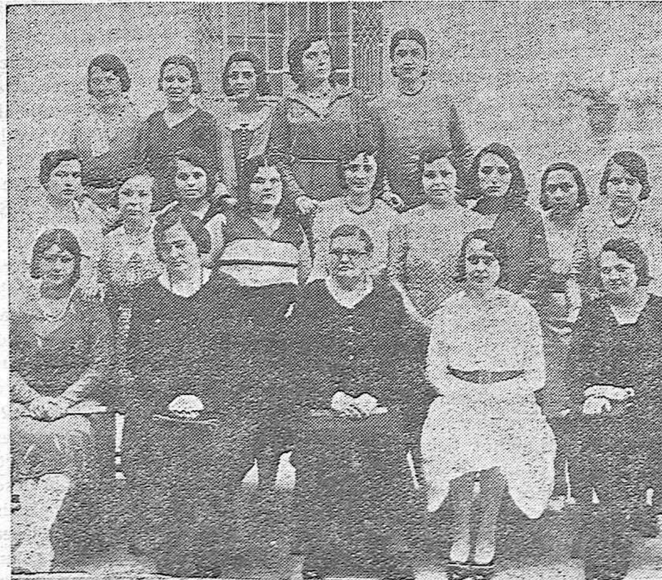
EN LA ESCUELA DE ARTES Y OFICIOS.—Alumnos de corte y confección que han obtenido diplomas

El doctor Orta, especialista en Partos y Matriz, se ha trasladado desde la Avenida del Gran Capitán, 36, a García Lovera, 2. Horas de consulta, de 11 a 1 y de 3 a 5