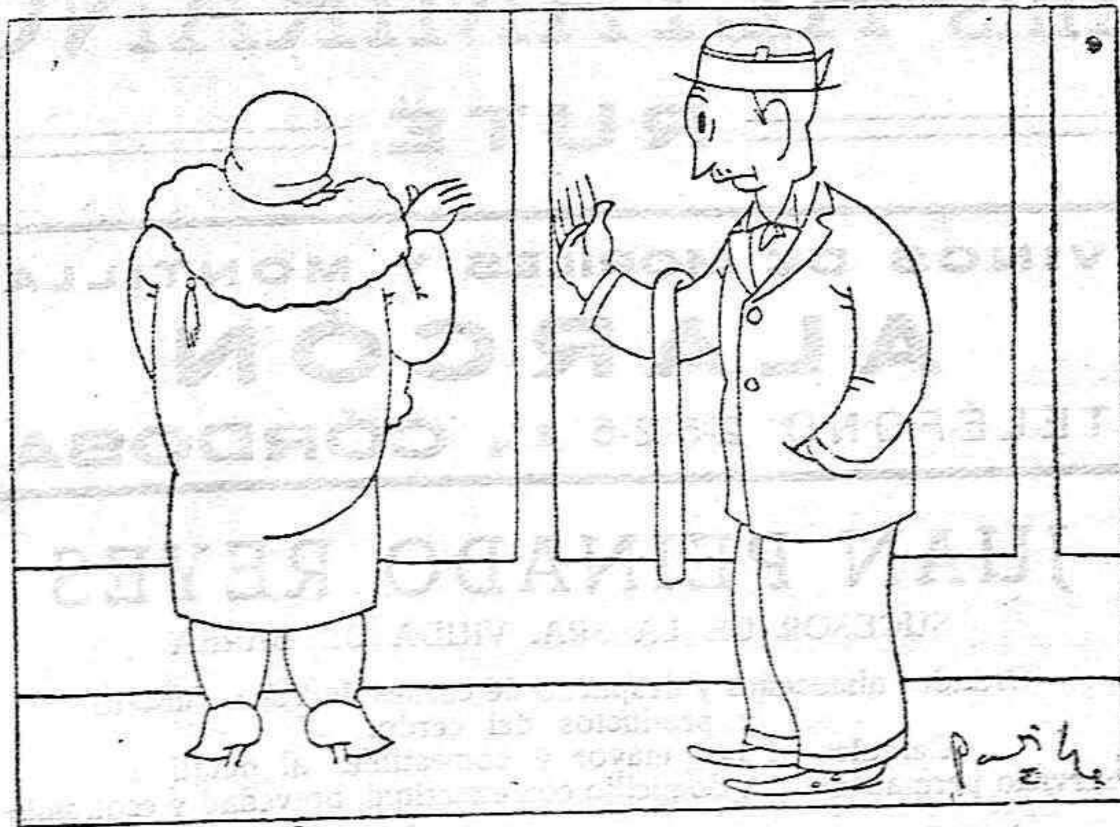
—¡Amos, anda! ¡Tres pesetas por un par de guantes! Es preferible comprar jabón y lavarse las manos cuando haga calor.