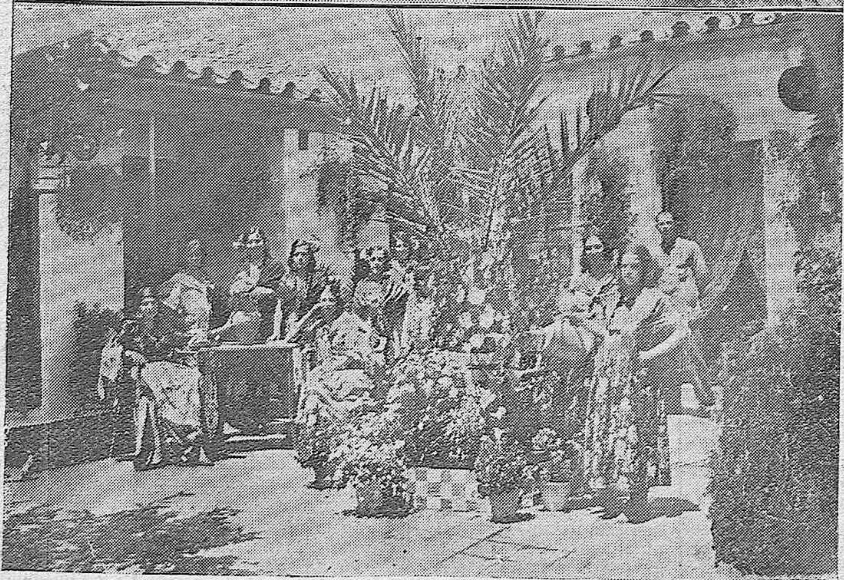
CONCURSO DE PATIOS CORDOBESES. —Arriba: Patio de la calle de San Juan de Palomares al que se ha concedido el primer premio de 500 pesetas. El Centro Filarmónico dió un concierto en el mismo. — Abajo: Patio de la calle del Chaparro, 20, al que se ha dado el segundo premio, de 300 pesetas, y en el que dió un concierto la Banda Municipal. (Fotos Santos).