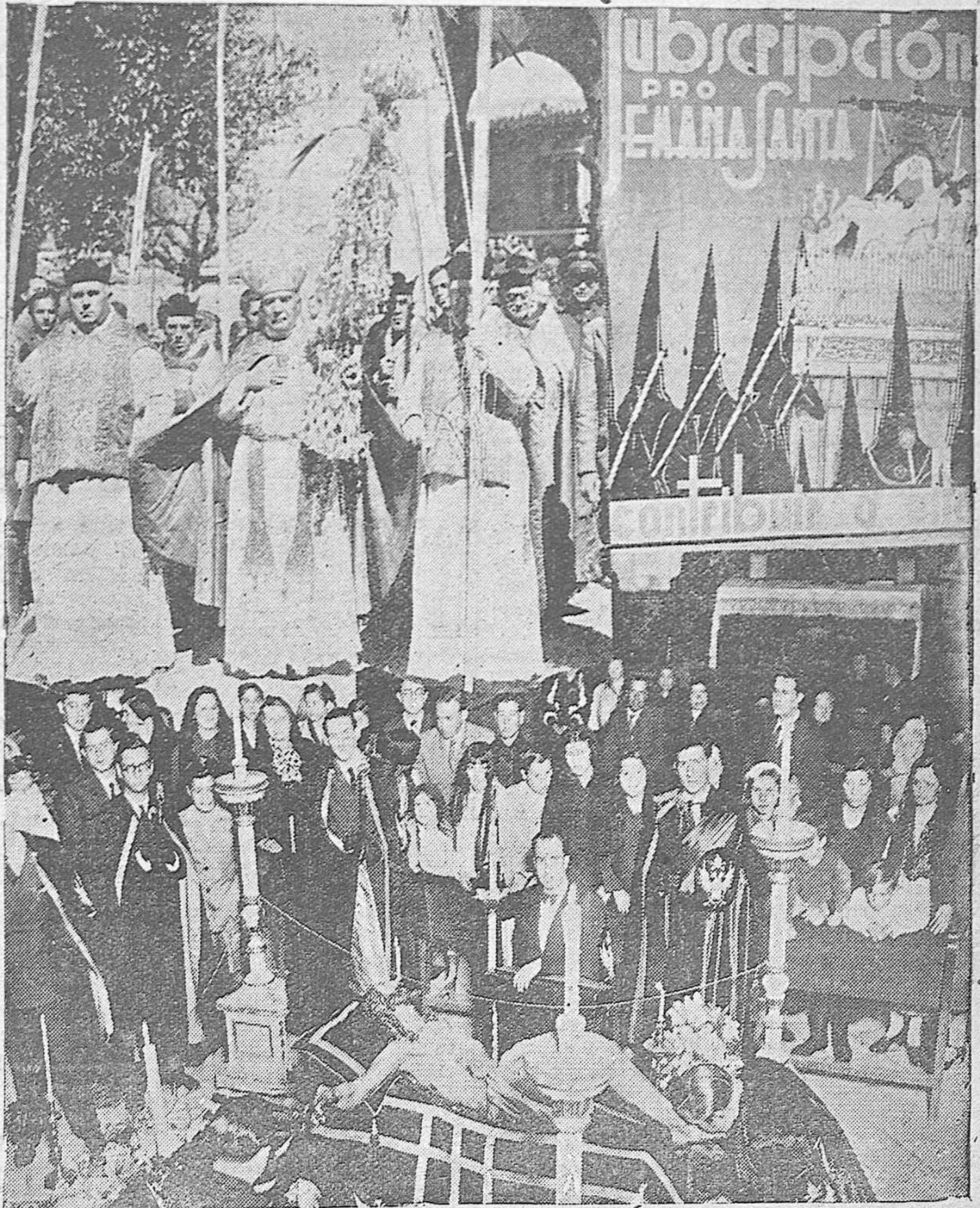
LA SEMANA SANTA EN CORDOBA.—La procesión de la Palma, al entrar por la Puerta del Perdón, presidiendo el Obispo.—Cartel de las Cofradías.—Un momento del solemne Besa-Piés del Cristo de las Angustias.