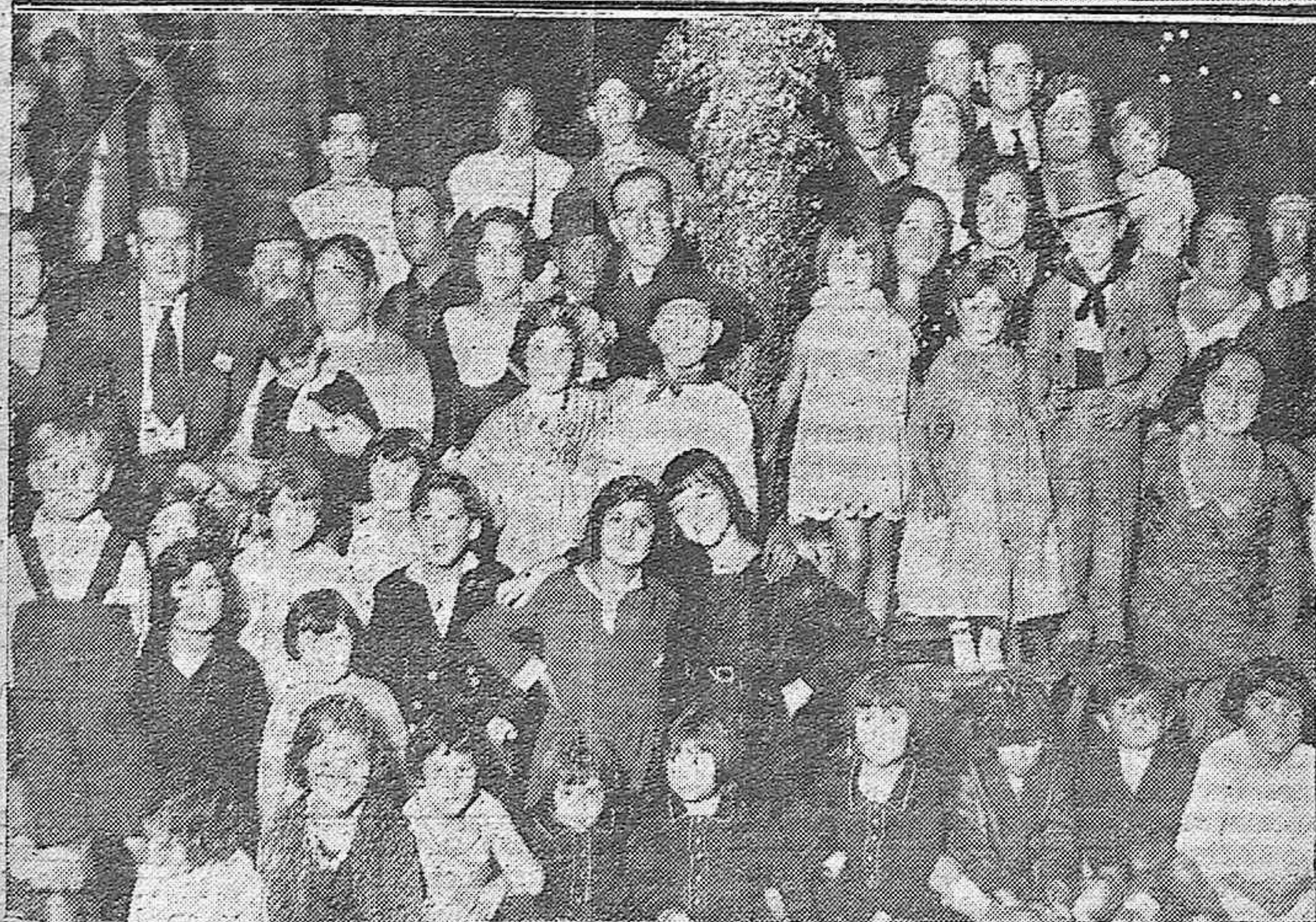
EN LA BARRIADA DE LA ELECTROMECHANICA. Dos interesantes grupos de niños que tomaron parte en el festival infantil celebrado durante estos últimos días con motivo de las importantes fiestas