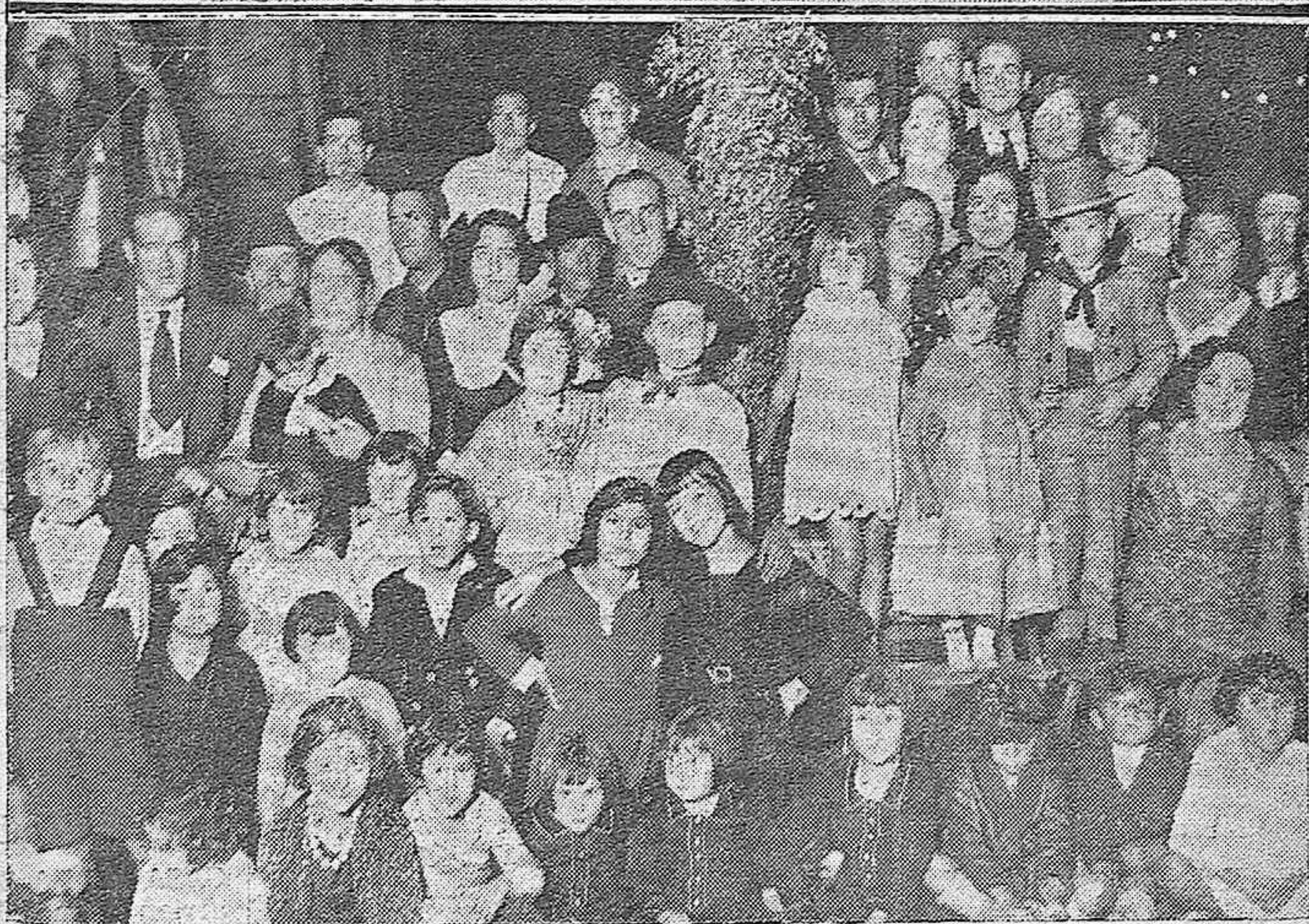
EN LA BARRIADA DE LA ELECTROMECHANICA. Dos interesantes grupos de niños que tomaron parte en el festival infantil celebrado durante estos últimos días con motivo de las importantes fiestas