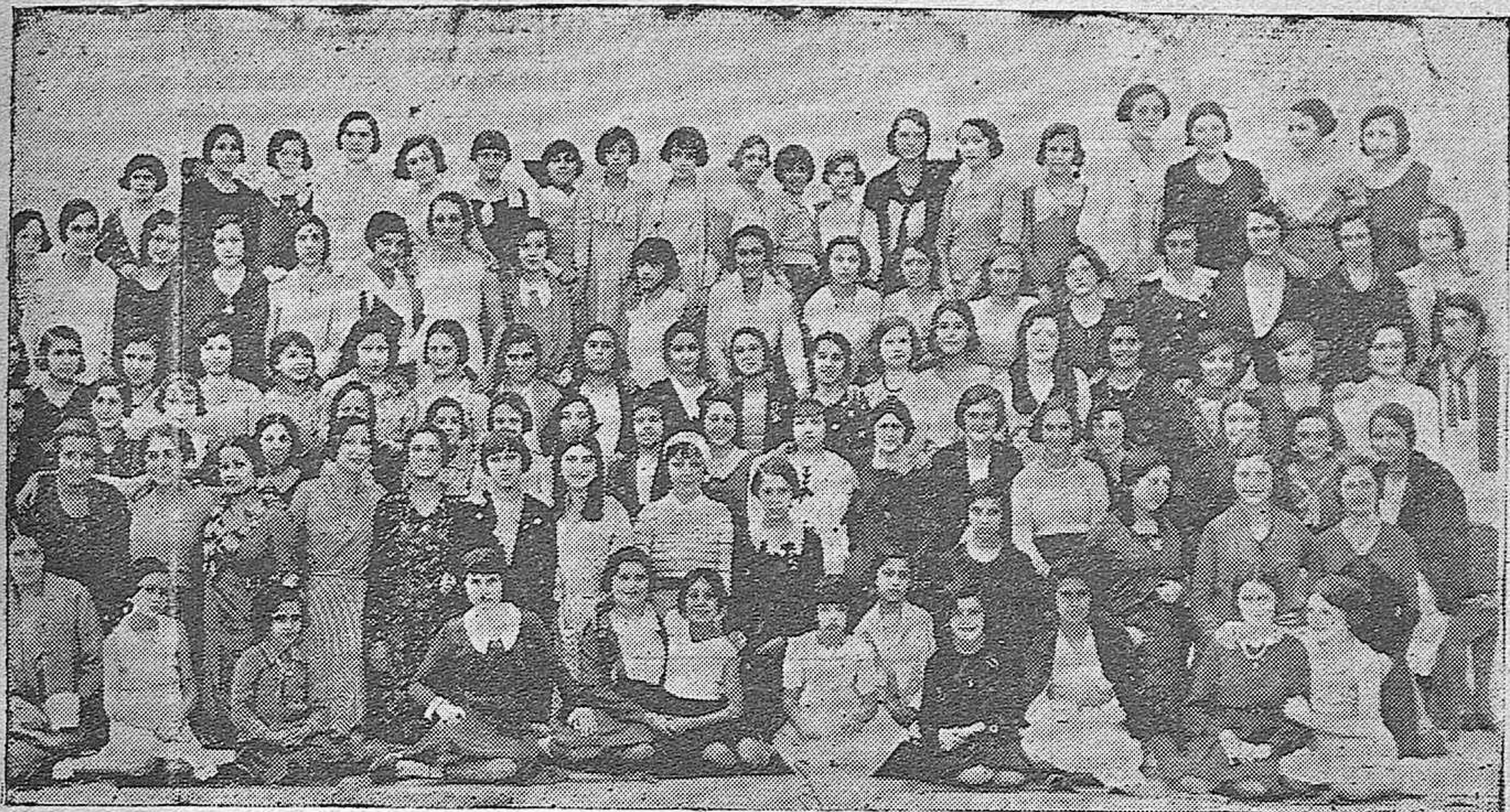
LA FIESTA DE LA RAZA EN EL INSTITUTO DE SEGUNDA ENSEÑANZA.—Grupo de encantadoras alumnas que concurrieron a los actos organizados por dicho centro de enseñanza.