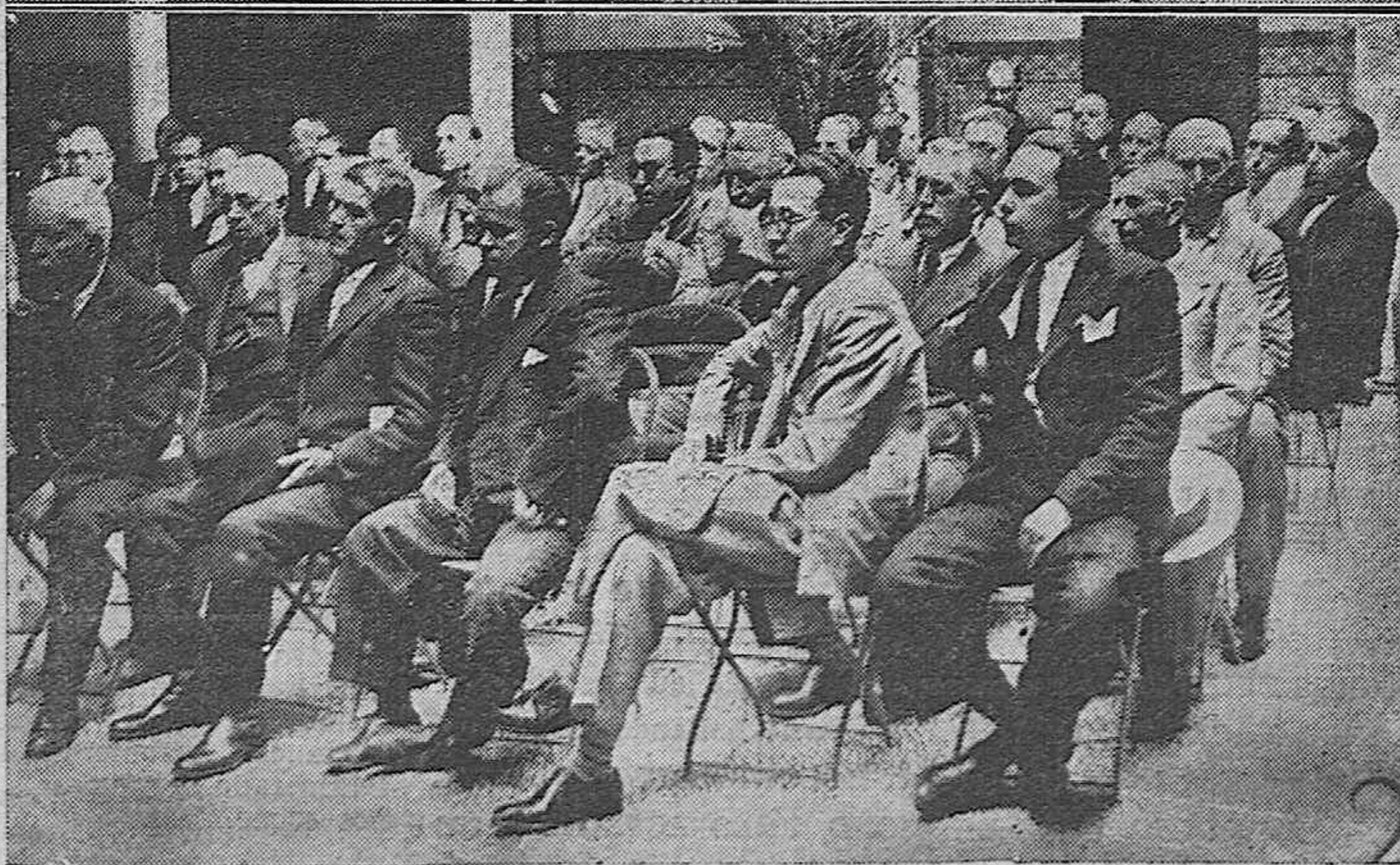
Arriba: Presidencia de la Asamblea Provincial de Alcaldes de la provincia celebrada hoy en la Diputación. El alcalde de Córdoba durante su discurso. Abajo: Una vista lateral de la Asamblea.