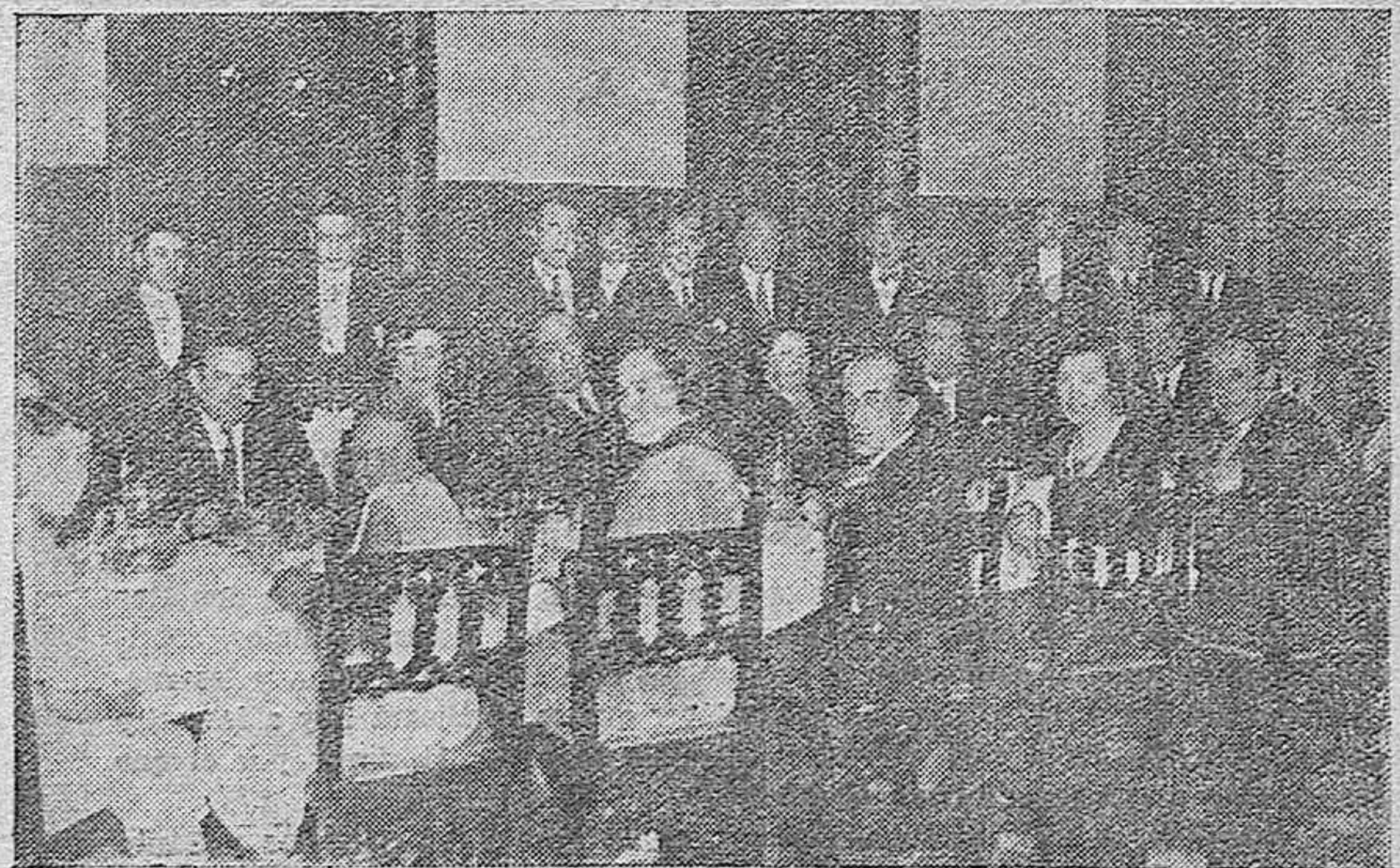
Banquete celebrado el viernes último en el Hotel Regina por el Club Rotario con asistencia del señor gobernador civil y familias de los socios