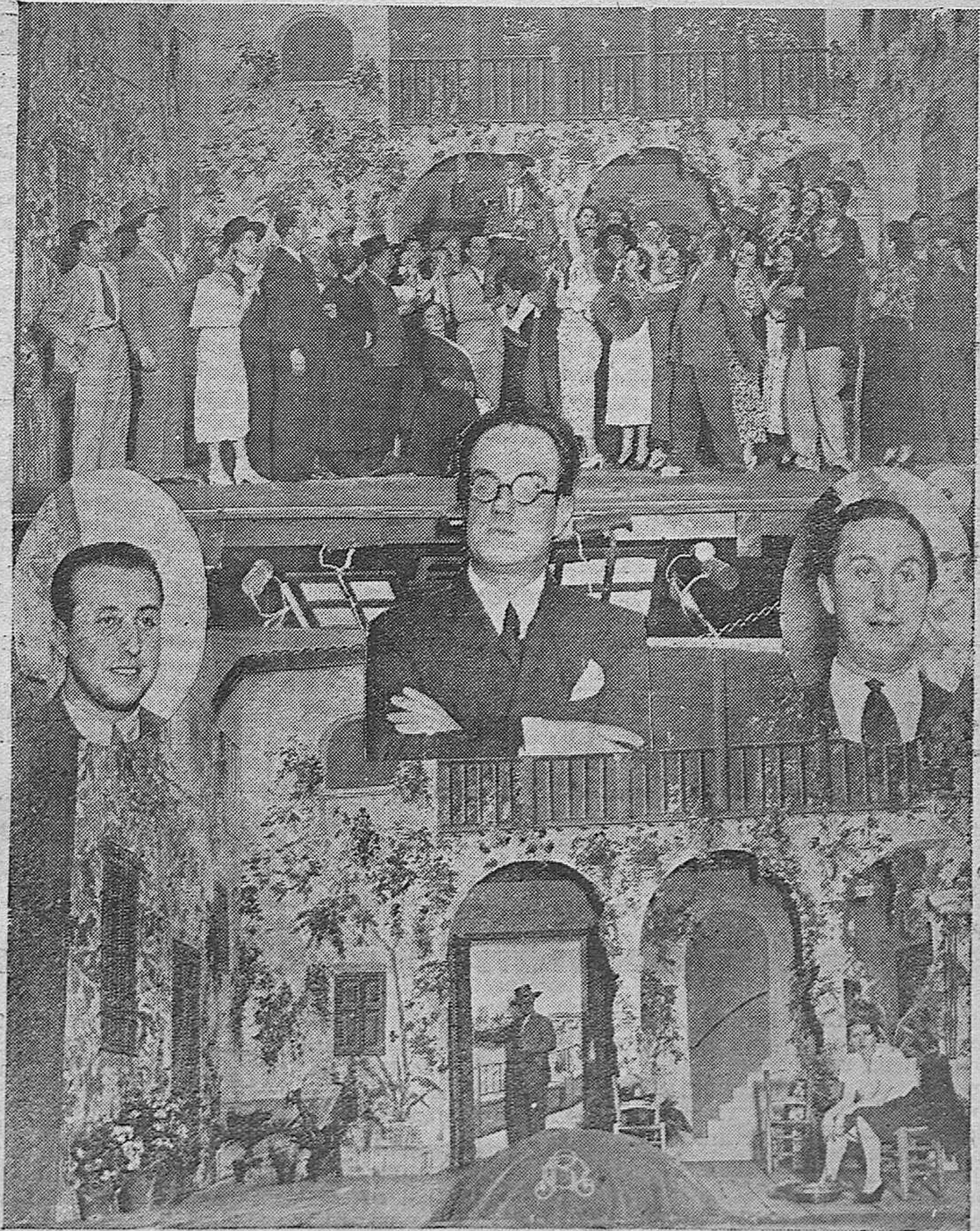
Dos escenas de la obra estrenada en el teatro Duque de Rivas titulada "La Chiquita Pionera".—En óvalos los autores del libreto señores Avilés y Alfaro y el inspirado compositor señor Villalonga.