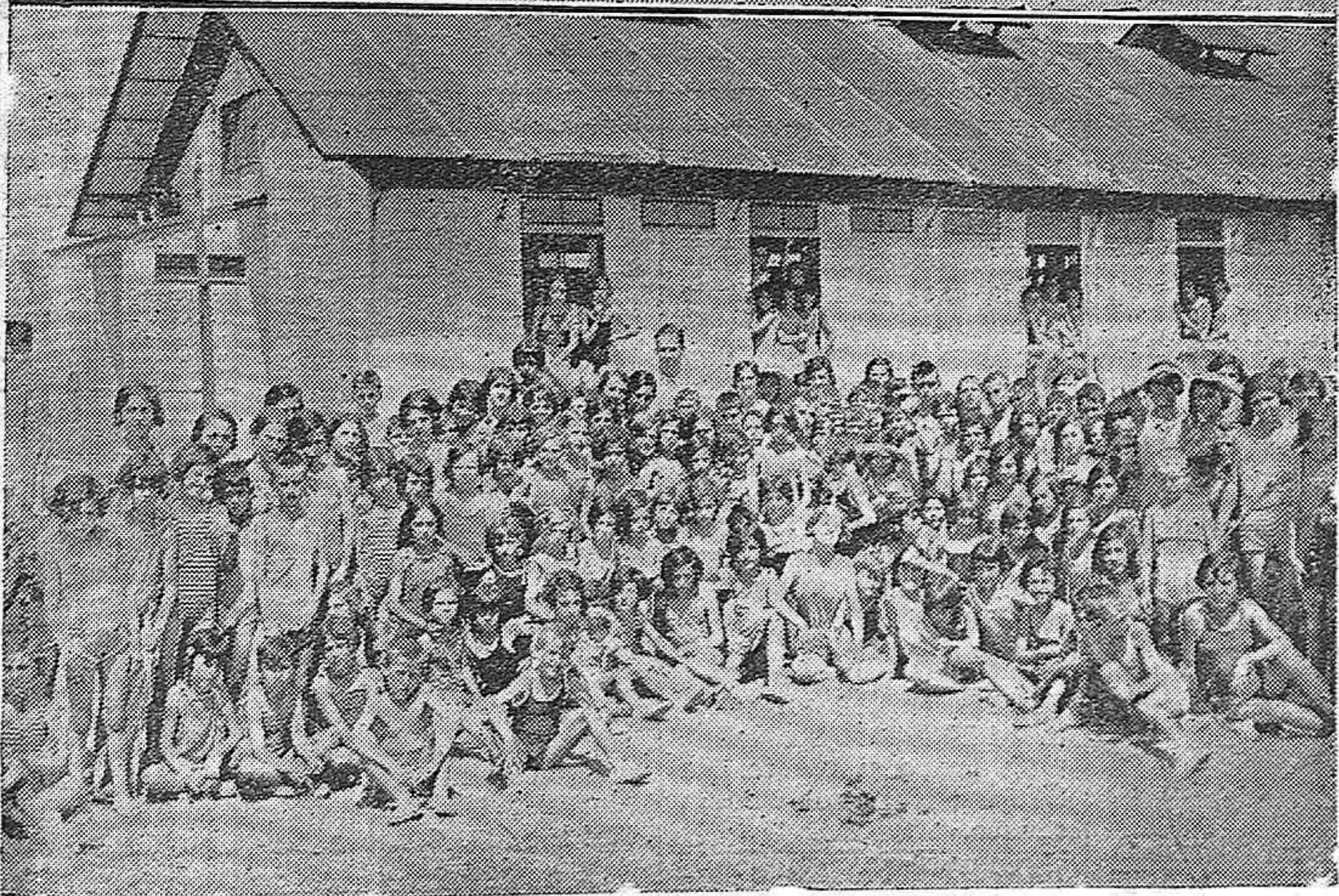
LAS COLONIAS ESCOLARES DE TORREMOLINOS.—Niñas y niños de otras colonias que veranean en la salutifera playa malagueña en amigable camaradería con sus compañeras las colonas cordobesas