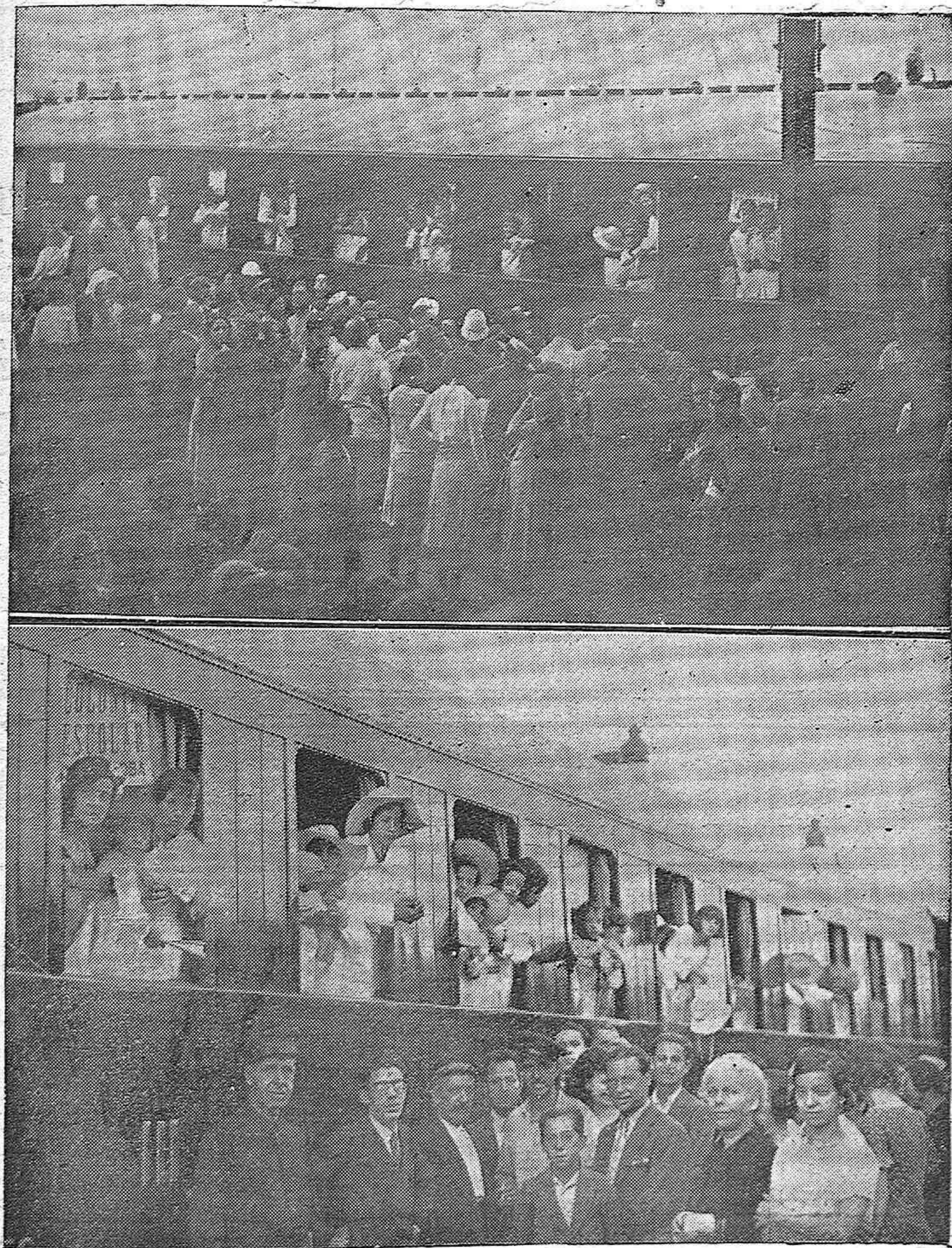
LAS COLONIAS ESCOLARES DEL MUNICIPIO. —Los familiares de los niños que forman la Colonia Escolar marítima que costea el excelentísimo Ayuntamiento despidiéndose de ellos antes de marchar a Torremolinos. Niñas de la colonia asomadas a las ventanillas momentos antes de partir el tren que las condujo a Málaga, en cuyas playas pasarán un mes de veraneo.