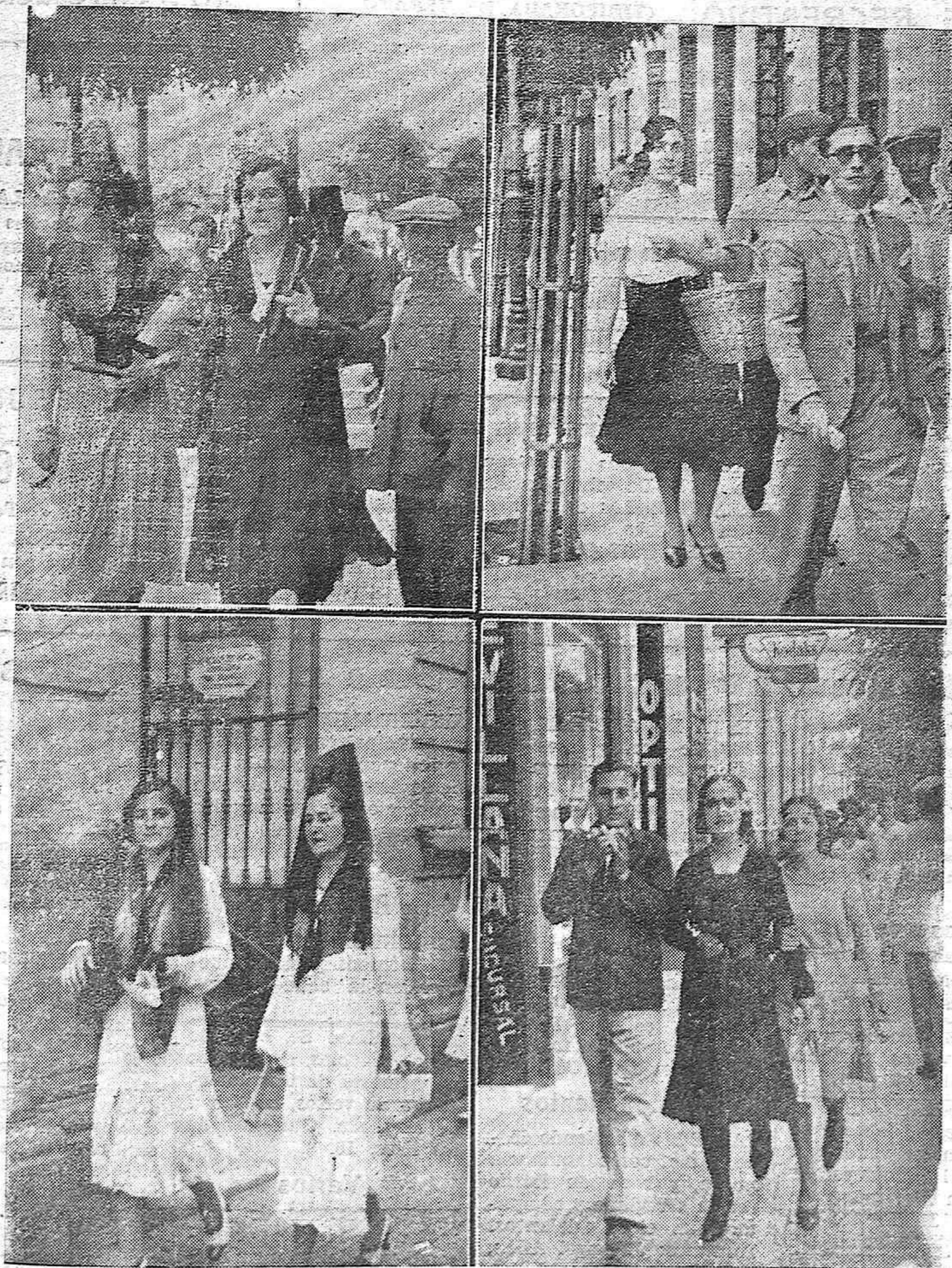
LAS MAÑANAS DOMINGUERAS EN LA CIUDAD. —Cuatro aspectos de nuestras principales vías en las que el reporter ha recogido en su klapp con la máxima democracia, la señorita, la modistilla que amartelada camina al lado de su novio y la criadita pulcra y garbosa que regresa del mercado después de efectuada su compra