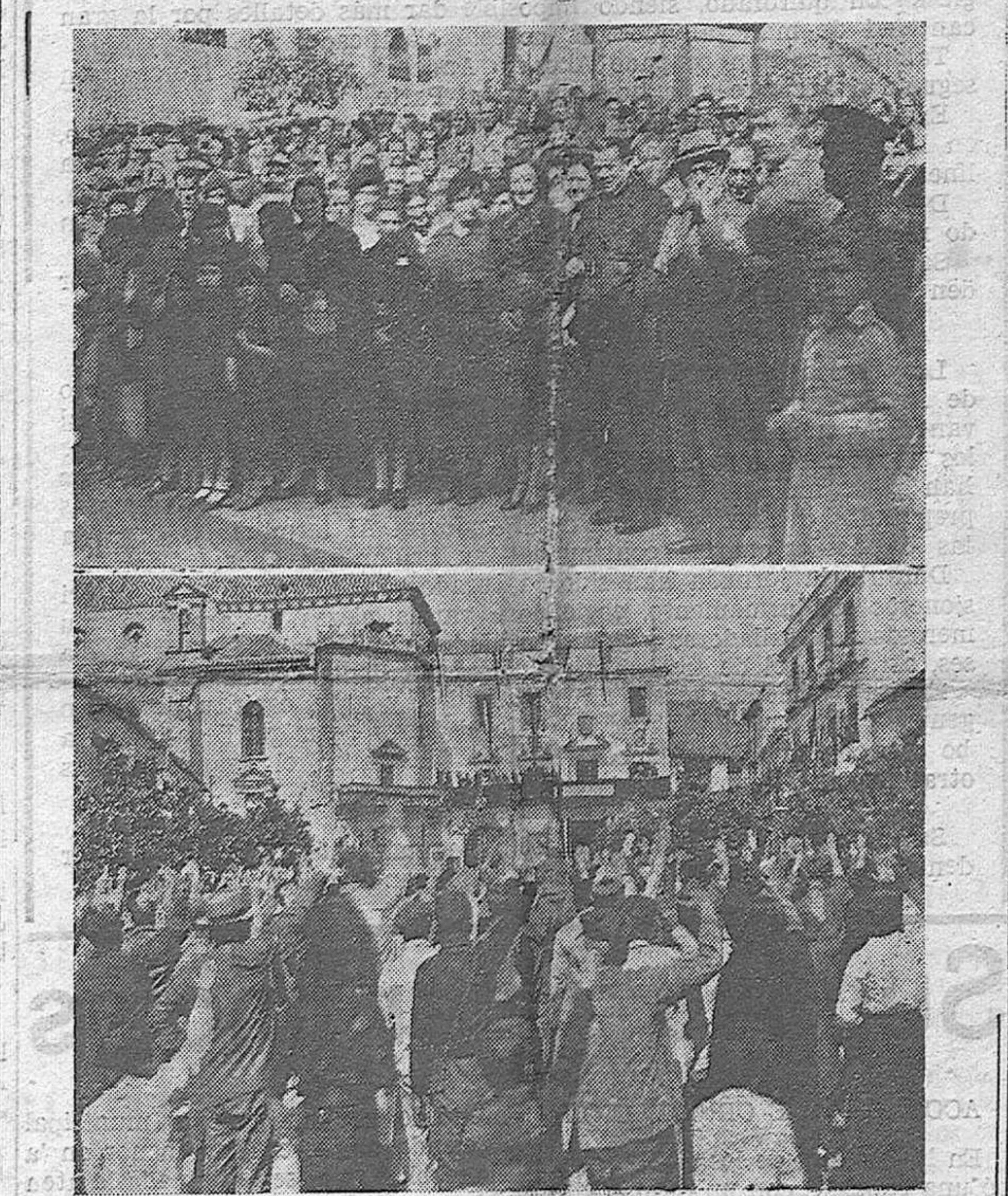
Las autoridades y mandos de Falange, presencian el desfile, en Bujalance, durante el acto del domingo.—En la plaza del Ayuntamiento, al entonarse el Himno de Falange, el pueblo saluda.

Sub Delegación Provincial del Estado, para Prensa y Propaganda, cuyas oficinas radicadas en el edificio de Radio Córdoba.