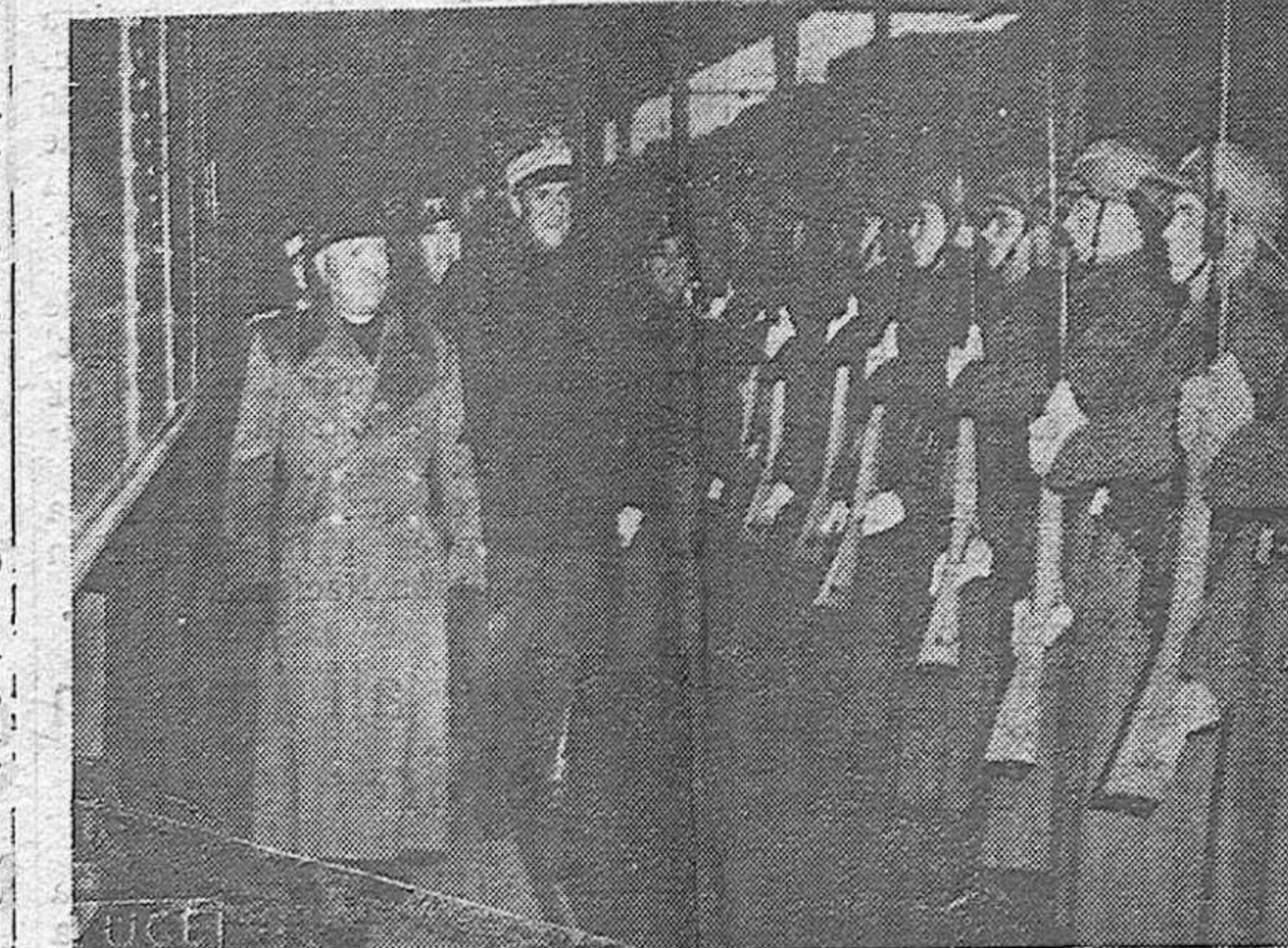
Llegó a Roma el Mariscal Graziani. Fué recibido por el Duce y los Camisas Negras. El Mariscal, en la revista de las fuerzas.

LECTURAS PARA EL SOLDADO.—necesita algunos ejemplares de obras de Aritmética, Gramática, Geografía, Historia de España e Historia Sagrada. Enviádselos a la Sub Delegación de Estado para Prensa y Propaganda, al edificio de Radio Córdoba.