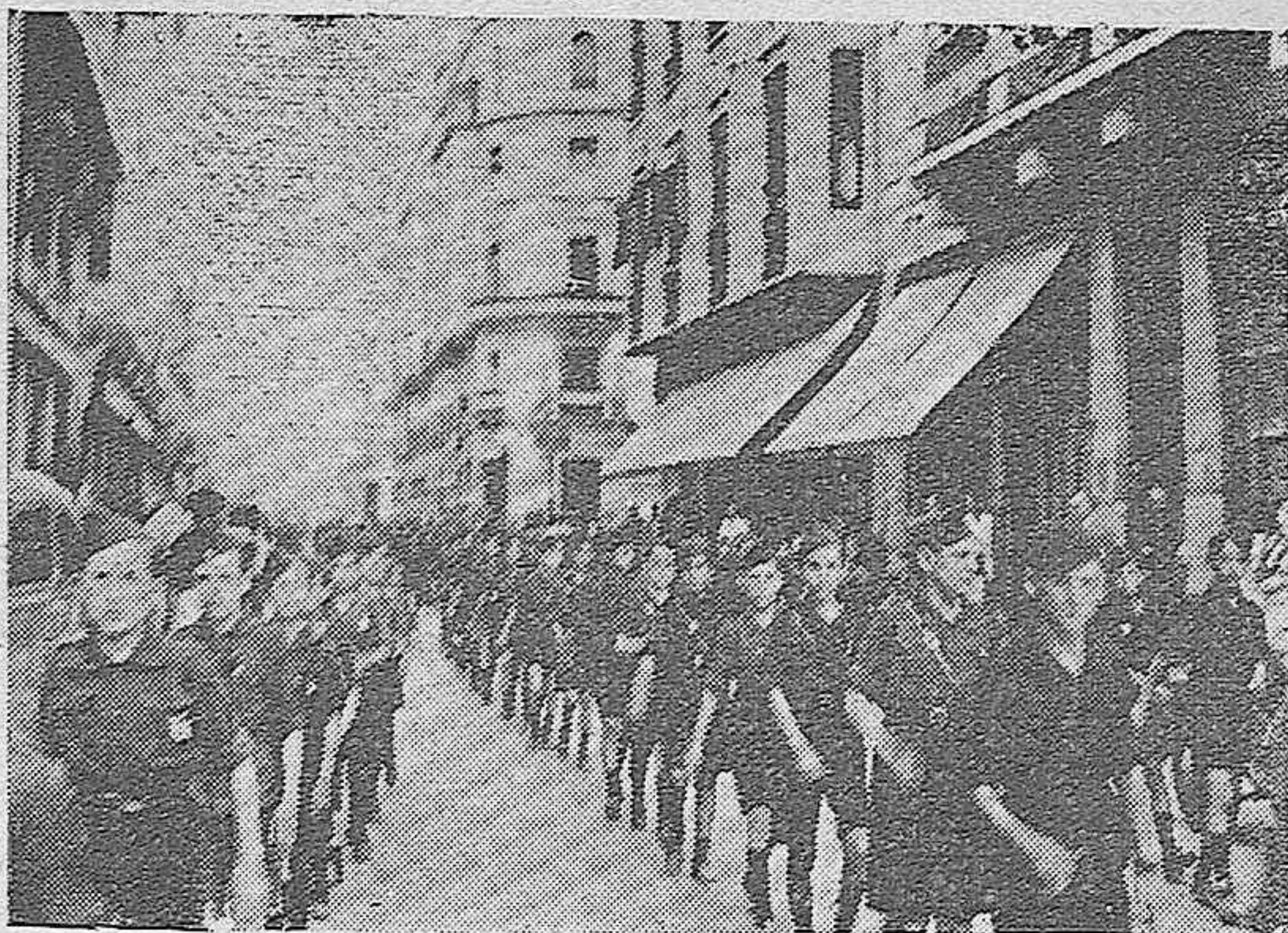
Flechas: la promesa que Falange hace a la Patria