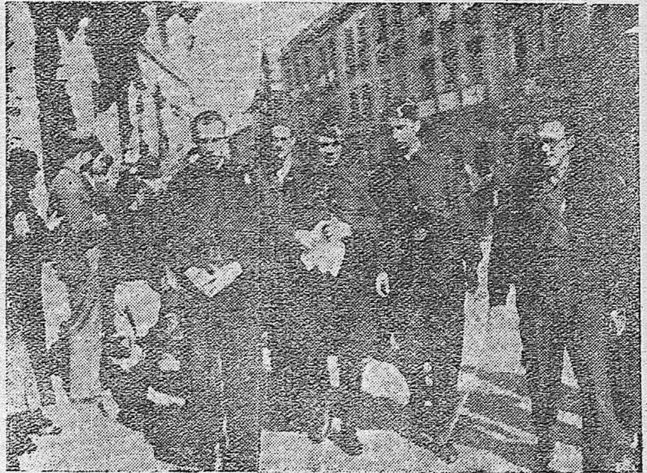
Los jefes de Falange Española de Córdoba, saliendo del funeral celebrado en S. Pablo por los camaradas muertos.

Todas las obras se mandarán a las Oficinas de "Flechas", situas en la Avenida de América, sin número (frente al depósito de máquinas de la estación de Cerro de San Pedro).