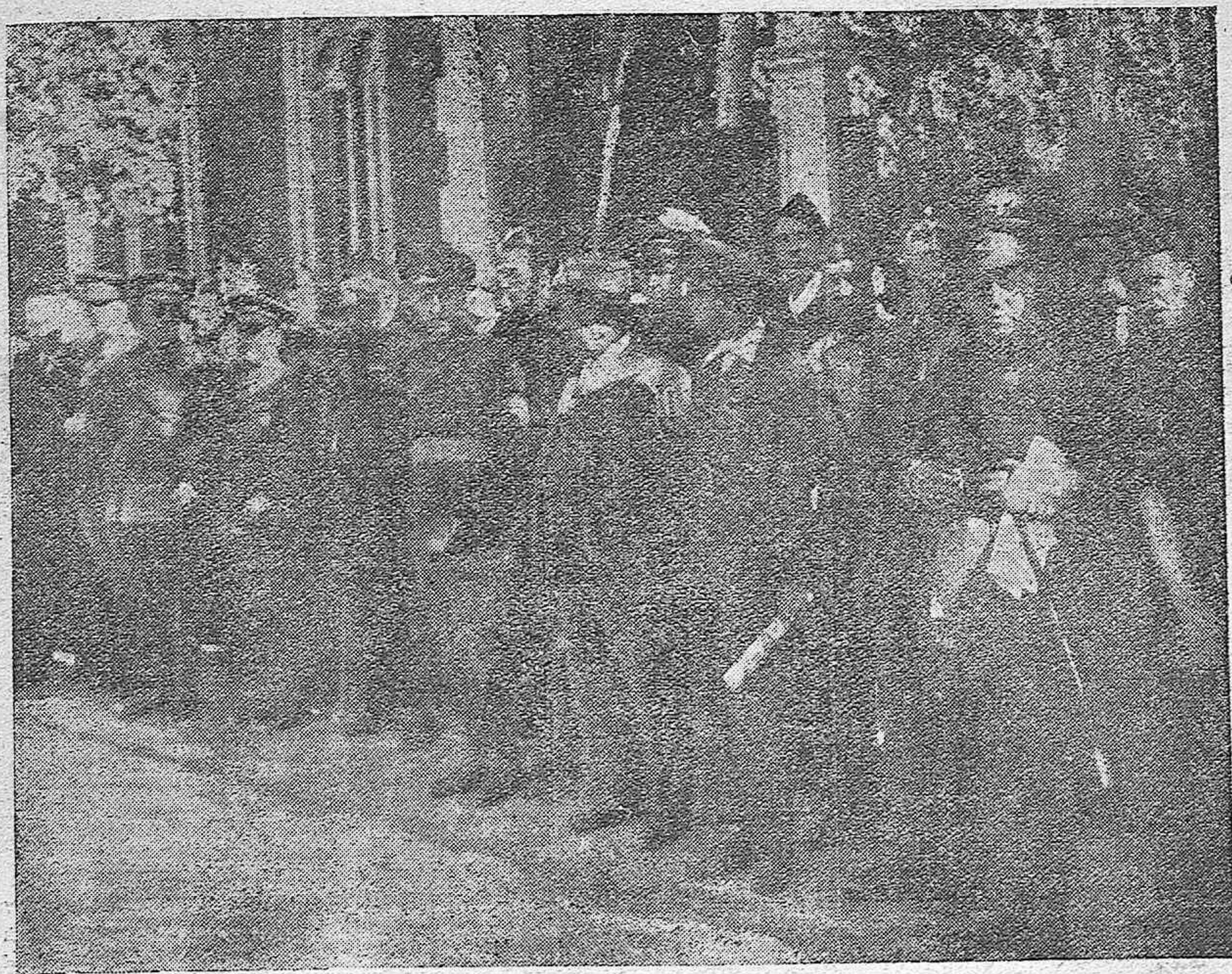
Las autoridades cordobesas presenciando el magnífico desfile de Falange Española, ante el Gobierno Civil.